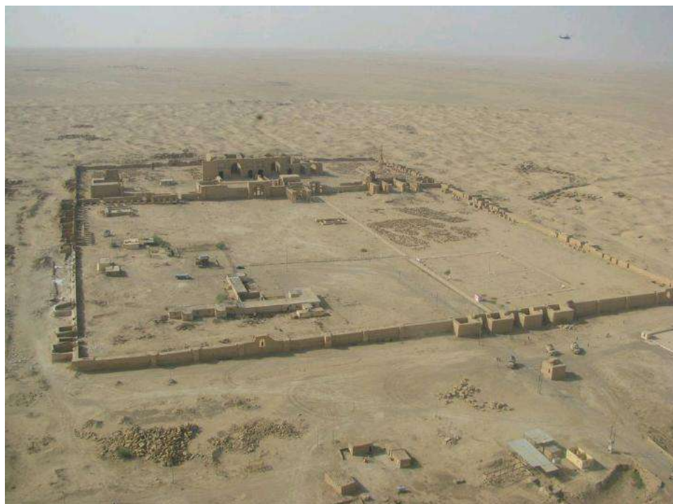
صورة رقم ١

وزارة السياحة والآثار العراقية التقرير السنوي عن تدمير الموروث الحضاري في محافظة نينوى من ١٠ حزيران ٢٠١٤ إلى ١٠ حزيران ٢٠١٥ ص ١٤