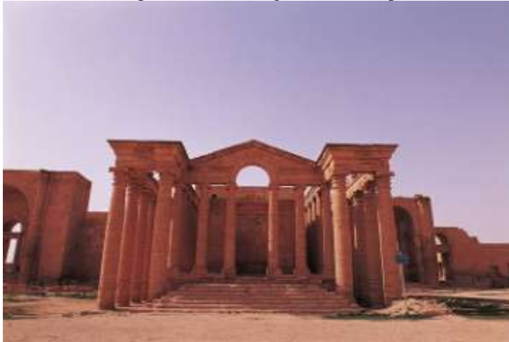
صورة رقم ٤ واجهة المبنى الرئيس للمدينة مقتبسة من الموقع الرسمي لليونسكو الموقع الرسمي لمنظمة اليونسكو باعتبار الحضر موقع للتراث العالمي http://whc.unesco.org/ar/list/277#top