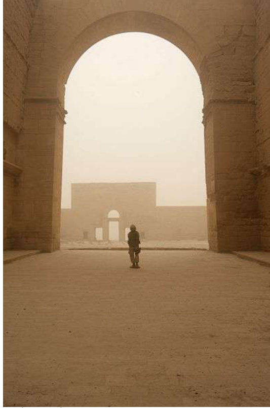
صورة رقم ٣ داخل المعبد الكبير وسط المدينة مقتبسة من الموقع الرسمي لمنظمة اليونسكو باعتبار الحضر موقع للتراث العالمي http://whc.unesco.org/ar/list/277#top