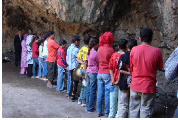
صورة رقم ١٣ تلاميذ أبناء المنطقة في زيارة للموقع