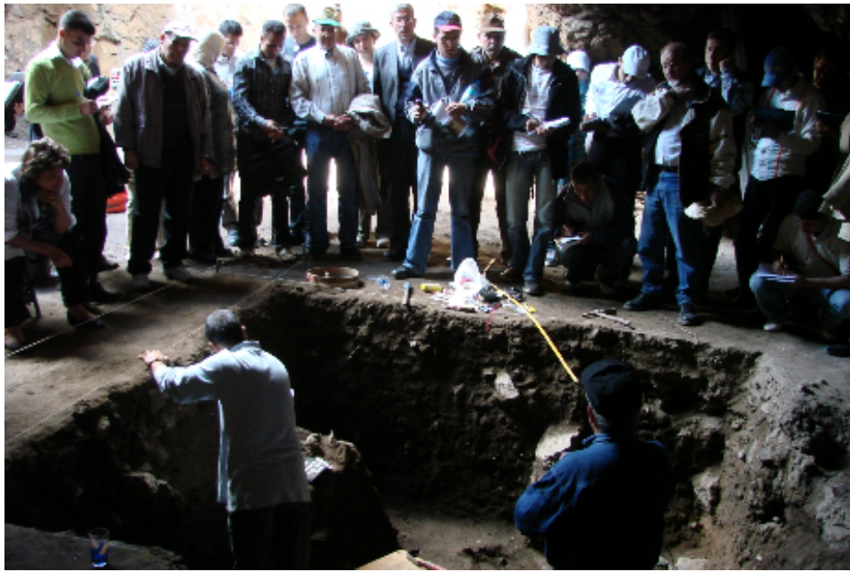
صورة رقم ١٢ زيارة طلبة الماجستير والدكتوراة من الجامعات المغربية