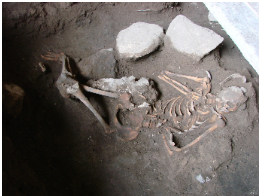
صورة رقم ٦ أ استخراج بقايا بشرية لشاب من قبر يوضح طريقة الدفن