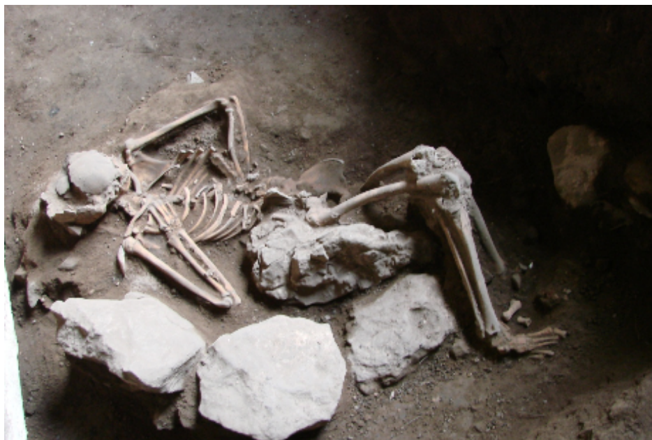
صورة رقم ٧ منظر آخر لبقايا بشرية للشباب المكتشف في المغارة محاط بالأحجار