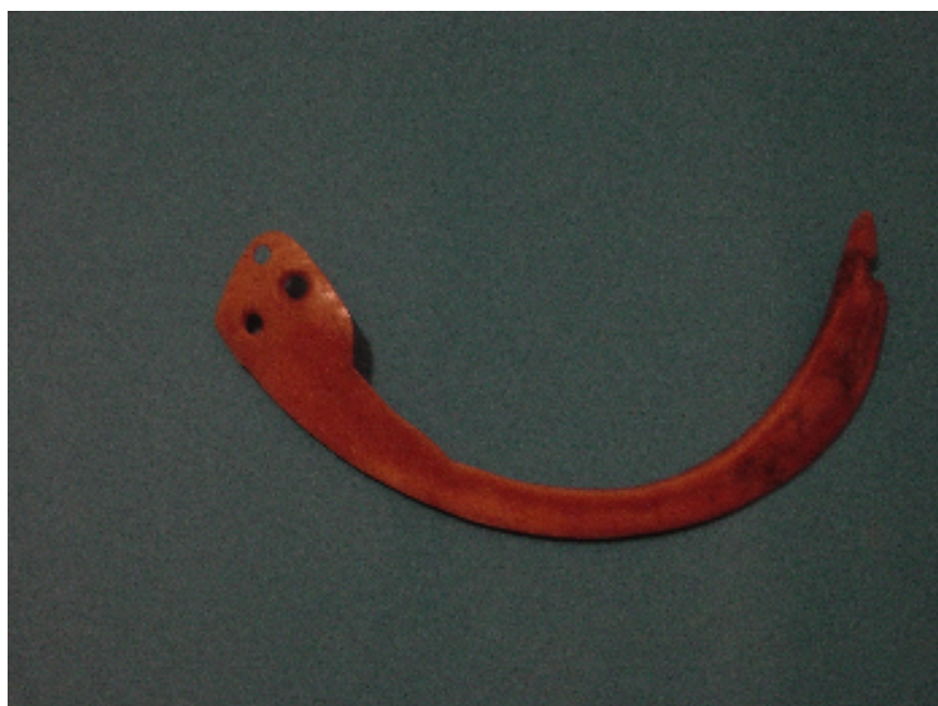
صورة رقم ١٠ عقد مصنوع من العاج على هيئة ثعبان