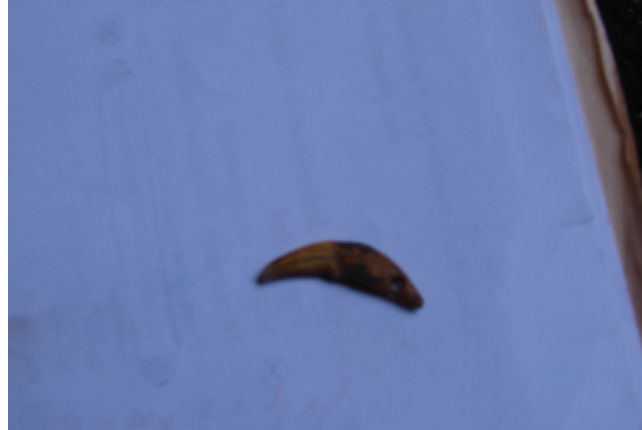
صورة رقم ١٥ قطعة من العقد صنعت من ناب خنزير