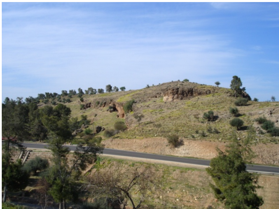
صورة رقم ١ موقع إفري (=كهف أو مغارة) ن اعمر أوموسى