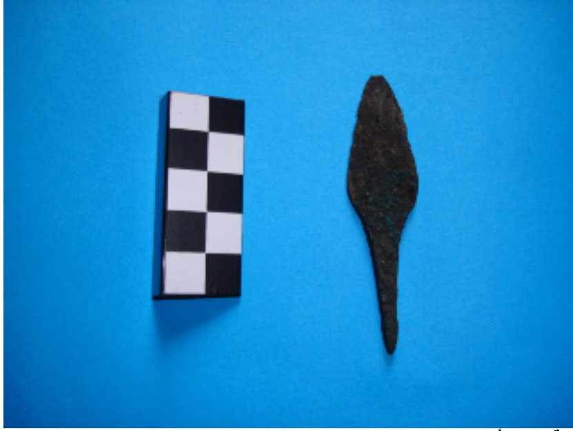
صورة رقم ٣ رأس السهم المعروف ب: بالميل المصنوع من البرونز المستخرج من المغارة