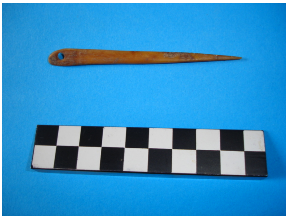
صورة رقم ٨ إبرة مصنوعة من العظم مستخرجة من الموقع