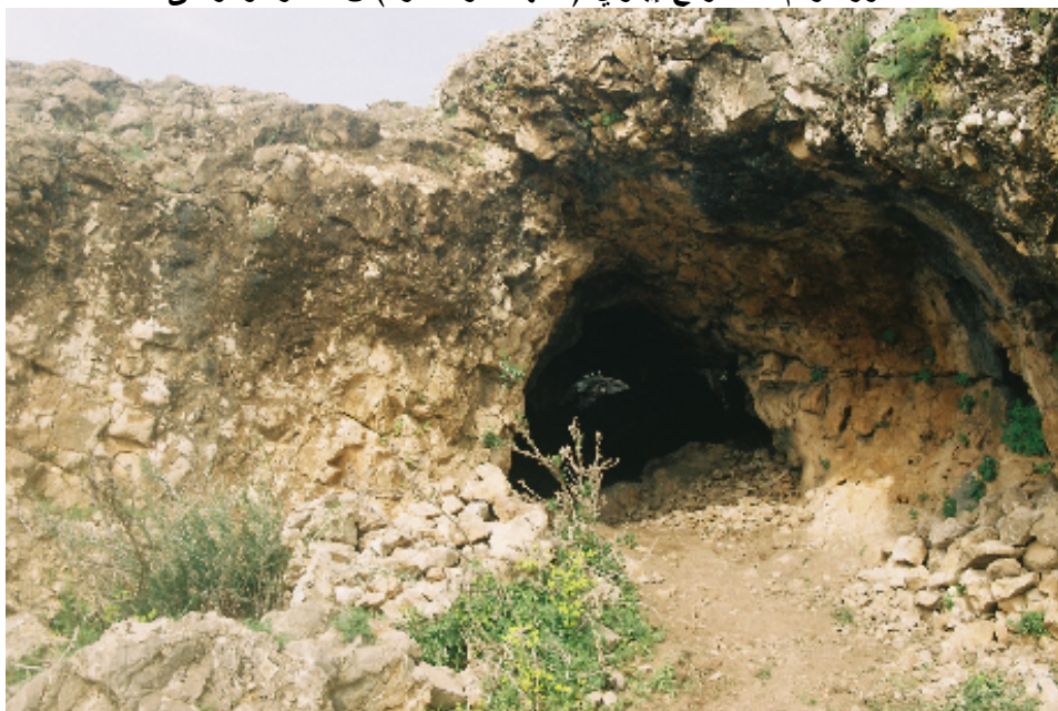
صورة رقم ٢ مدخل إفري ن اعمر أوموسى