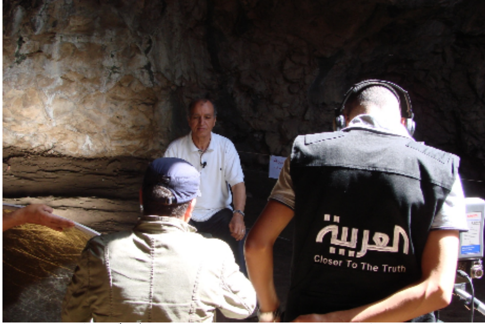
صورة رقم ١١ اهتمام مختلف وسائل بالمكتشفات الأثرية بالموقع