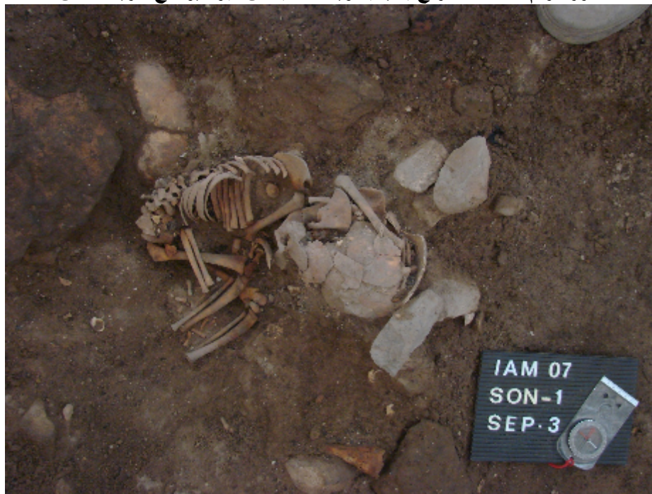
صورة رقم ٦ ب قبر لبقايا طفل