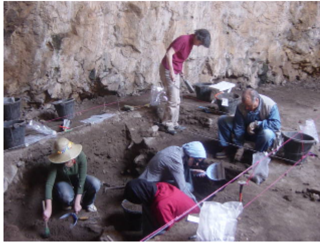
صورة رقم ١٤ عملية التنقيب يشارك فيها طلبة جامعيون