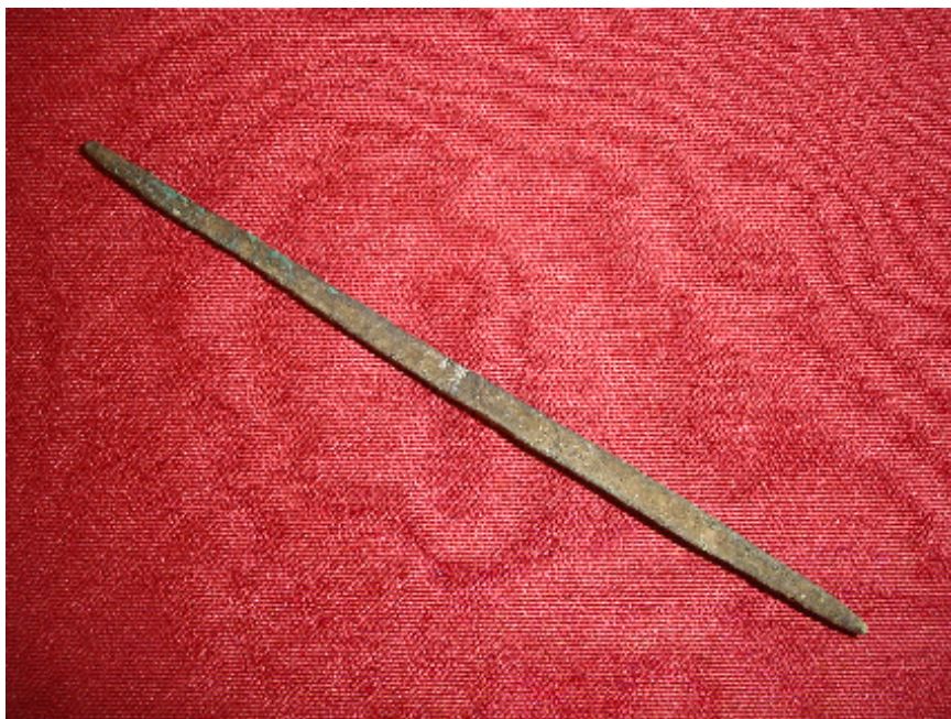
صورة رقم ٩ مخرز من النحاس