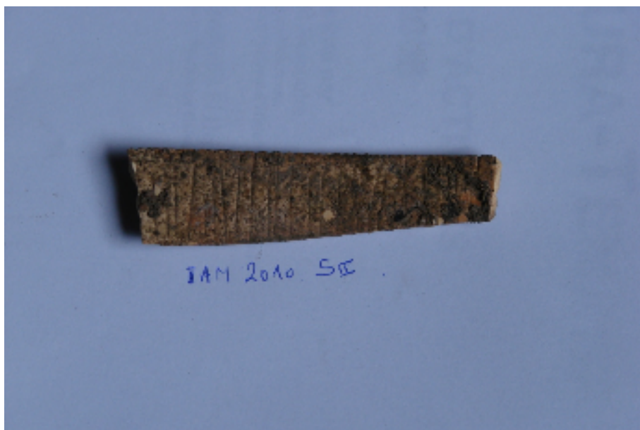
صورة رقم ٥ أ قالب من العظم كان يستعمل لزخرفة الفخار الجرسى الشكل