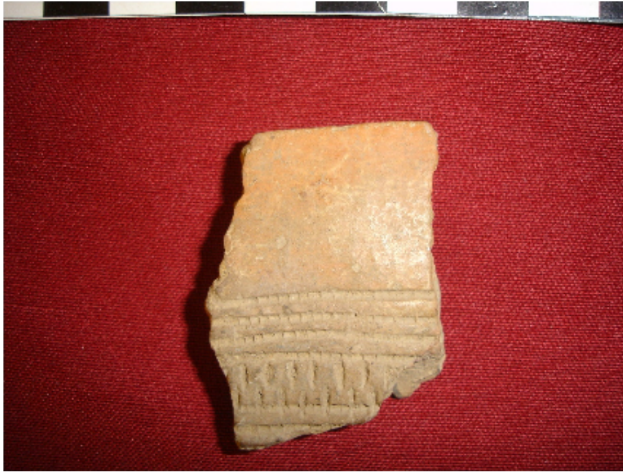
صورة رقم ٤ نموذج من الفخار الجرسى الشكل المكتشف في المغارة