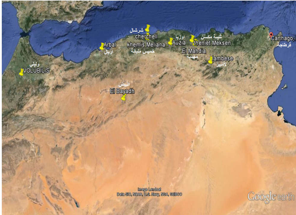
المناطق التي عرفت تواجد قبائل البوار (حسب النقوش)

فهذه الثورات هي نتيجة التوسع الروماني الذي نتج عنه تصدي محلي لم يستطع الرومان إخماده لا بالقوة، ولا بالدبلوماسية مثل ما أشارت إليه النقوش عندما تحدثت عن معاهدة بين الحاكم الروماني وملوك البوار، مما يؤكد مرة أخرى ان روما تفاوضت مع أشخاص ذوي قوة وسيادة، وان النظام السياسي الروماني خاصة في الفترة المتأخرة لم يعد قادرا على ضمان مصالح السكان الرومانيين من أصول محلية، الذين كانوا يبحثون دوما عن حل وسط مع القوى السياسية الجديدة التي جاءت بعد روما.