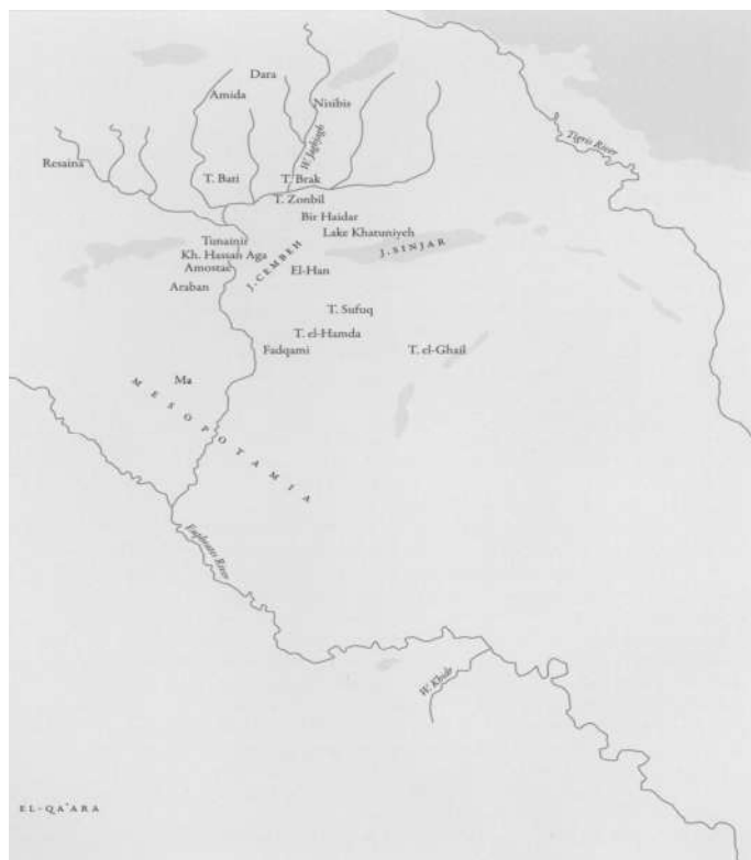
خريطة توضح موقع مدينتي دارا ونصيبين ونهر الفرات

نقلا عن كتاب: نينا فيكتوريا بيغو ليفسكيا: العرب على حدود بيزنطة