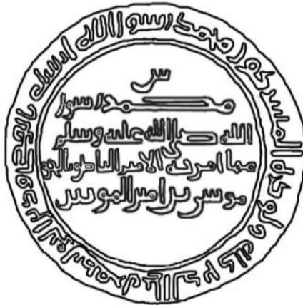
شكل (٢) رسم توضيحي لكتابات درهم الناطق بالحق موسى