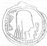
رأس لحاكم عربي (٢٦ - أ)