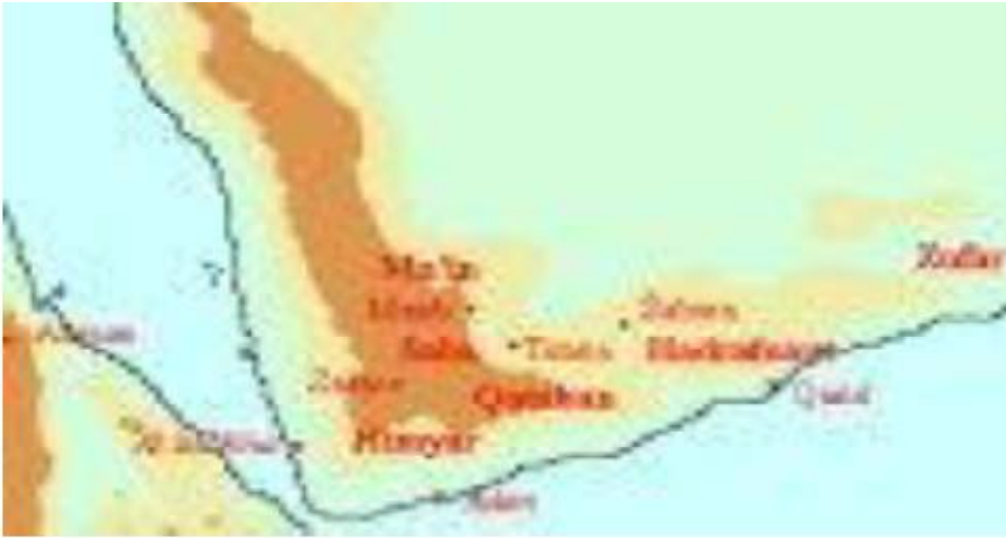
خريطة رقم (١)