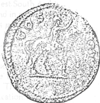
الإمبراطور "هادريان راكباً جواده" (٢٢ - ب)