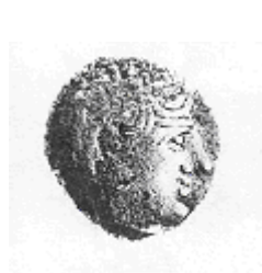
الإلهة "أثينا" (٤ - ١)