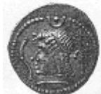
رأس لحاكم عربي (١٧ - أ)