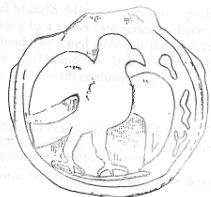
نسر (٢٦ - ب)