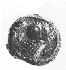
البومة (٣ - ب)