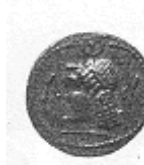
رأس لحاكم عربي (١٨ - أ)