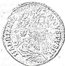
الإمبراطور "هادريان" (٢٢ - أ)

نقلاً عن: Sedov A. V. & Aydarus U., op. cit., p. 38.