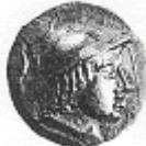
يوكراتيدس (١٦ - أ)