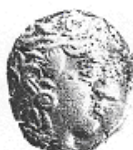
الإلهة "أثينا" (١٤ - أ)