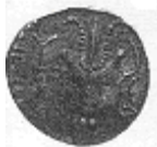
رأس ثور وبجانبه قرن الخيرات (١٧ - ب)