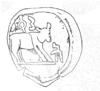
ثور (٣١ - ب)