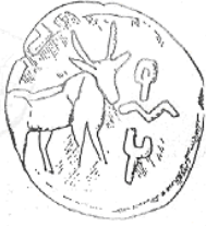
ثور (٢٨ - ب)