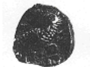
البومة (١٢ - ب)