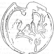
نسر (٢٧ - ب)