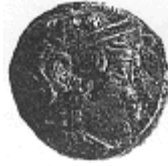
الإلهة "أثينا" (٧ - أ)