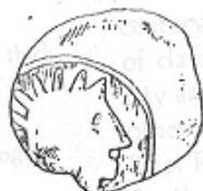
الإله "هليوس" (٢٤ - أ)