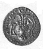
رأس ثور وبجانبه قرن الخيرات (١٩ - ب)