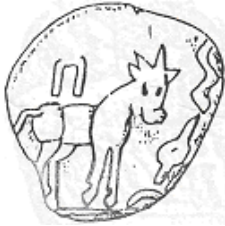
ثور (٢٩ - ب)