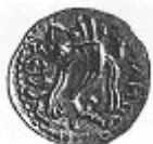
قرن الخيرات (١٦ - ب)