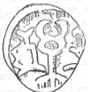
الكريكيون (٢٥ - ب)