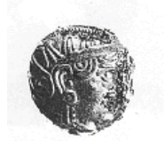
الإلهة "أثينا" (٥ - ١)