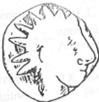
الإله "هليوس" (٢٥ - أ)