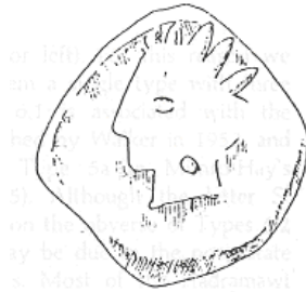
الإله "هليوس" (٣٢ - أ)