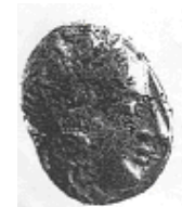
الإلهة "أثينا" (٩ - أ)