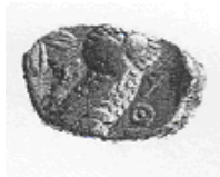
البومة (٦ - ب)