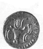
رأس ثور وبجانبه قرن الخيرات (٢٠ - ب)