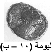
البومة (١٠ - ب)