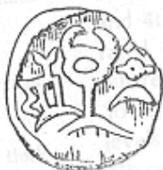
الكريكيون (٢٤ - ب)