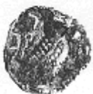
البومة (١٥ - ب)