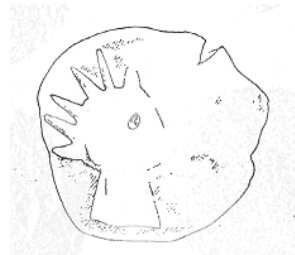
الإله "هليوس" (٣١ - أ)