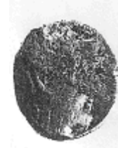
الإلهة "أثينا" (٨ - أ)