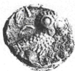
البومة (١٤ - ب)