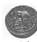
رأس لحاكم عربي (٢١ - أ)