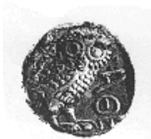
البومة (٥ - ب)