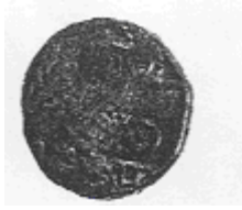
البومة (٧ - ب)

نقلًا عن: Ib Mnuro-Hay S. C., op. cit., pl. 12.id.