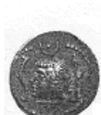
رأس لحاكم عربي (١٩ - أ)