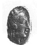
الإلهة "أثينا" (٦ - أ)