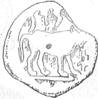
ثور (٣٠ - ب)