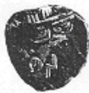
الإلهة "أثينا" (١٢ - أ)