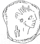
الإله "هليوس" (٣٠ - أ)