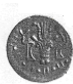
رأس ثور وبجانبه قرن الخيرات (٢١ - ب)