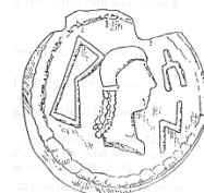
رأس لحاكم عربي (٢٧ - أ)