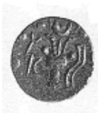
رأس ثور وبجانبه قرن الخيرات (١٨ - ب)