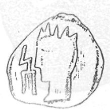
الإله "هليوس" (٢٩ - أ)