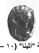
الإلهة "أثينا" (١٠ - أ)