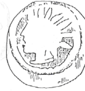
الإله "هليوس" (٢٨ - أ)