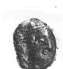
الإلهة "أثينا" (٣ - ١)