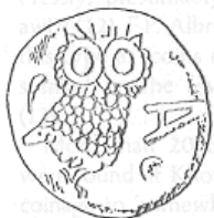
البومة (٢٣ - ب)

نقلاً عن: Sedov A. V. & Aydarus U., op. cit., p. 38.