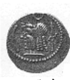
رأس لحاكم عربي (٢٠ - أ)