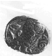
البومة (٩ - ب)