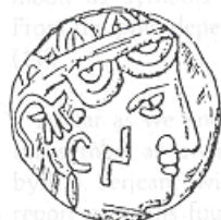
الإلهة "أثينا" (٢٣ - أ)