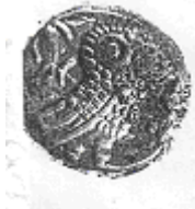
البومة (٨ - ب)