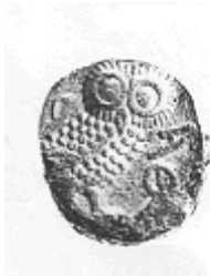
البومة (٤ - ب)