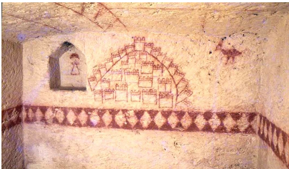
الصورة ٢ : (الرواح) في شكل ديك يستعد لدخول (الريفيم) Mounir Fantar , Expressions de l'au-delà....., p47