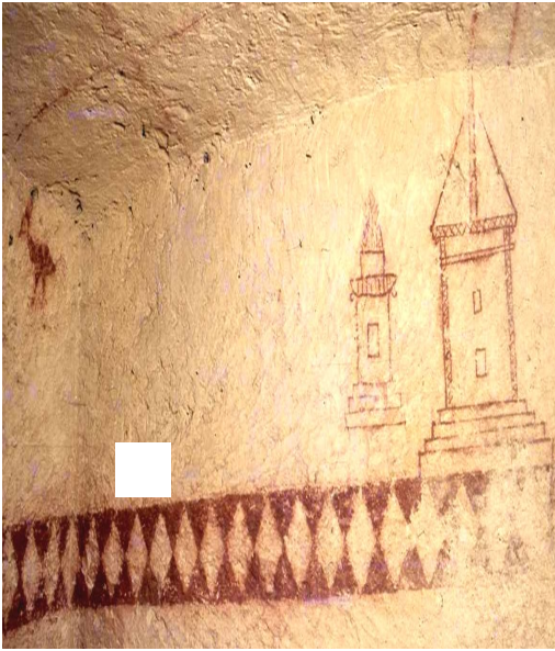
( الرّواح ) ممثلة في شكل ديك مغادرا القبر