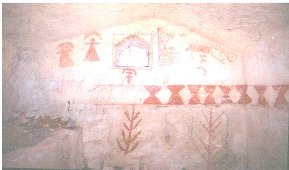
- الصورة ٣ : قبر بوني بـ (قرية - Korba) تونسقلا عن : P.Cintas , " Didon est elle au paradis des iles ? , "Mélanges d'archéologie , d'épigraphie et d'histoire offerts à J.Carcopino, Paris , 1966