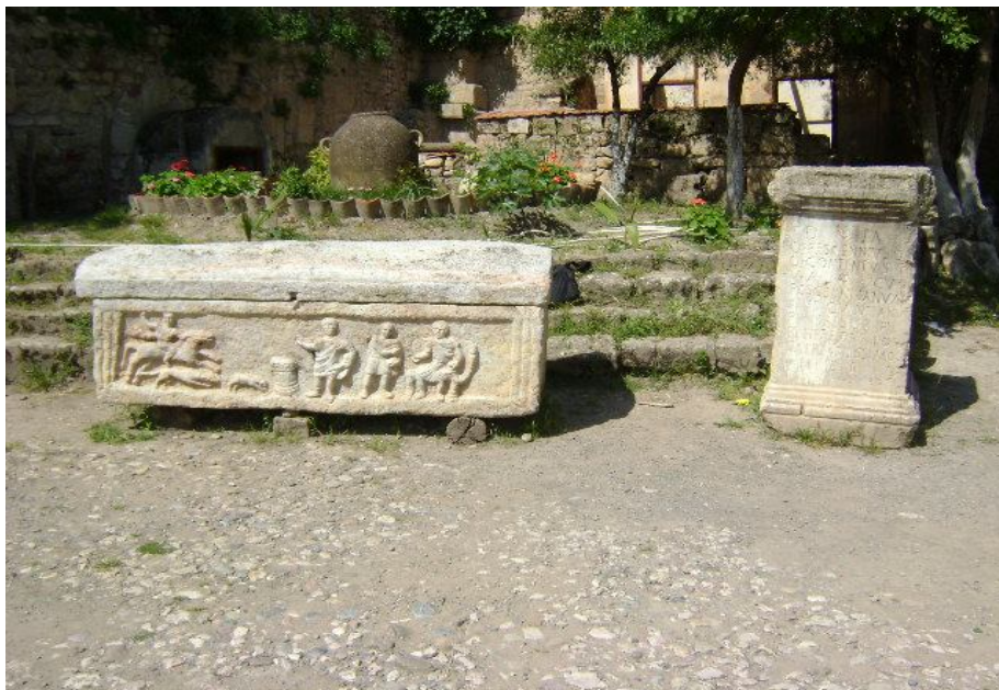
مذبح و تابوت يعودان للفترة الرومانية