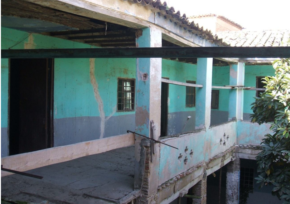
منظر داخلي لأحد المنازل ذات طابق