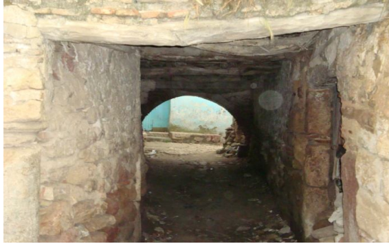
أحد دروب القصبية