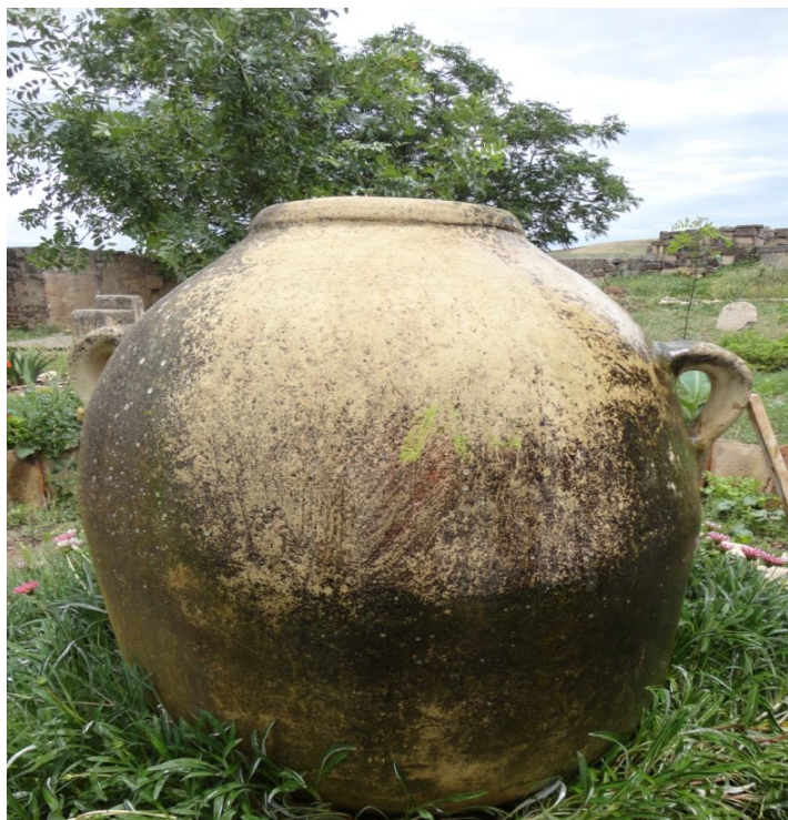
جارية من الفخار