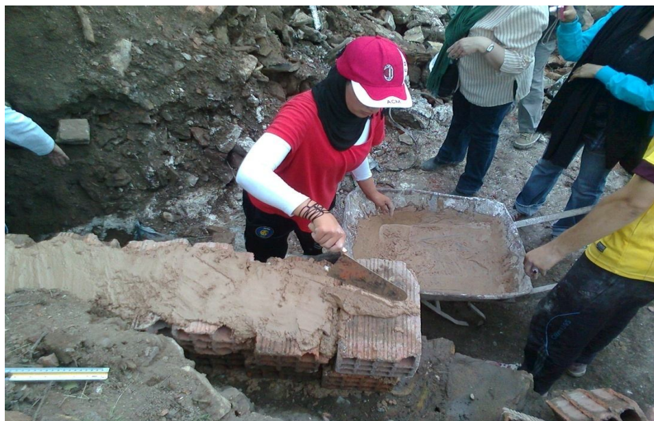
الفرن أثناء عملية الترميم (استعمال الماد المحلية)