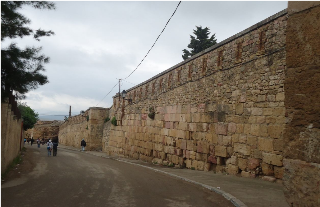
منظر خارجي لسور المدينة