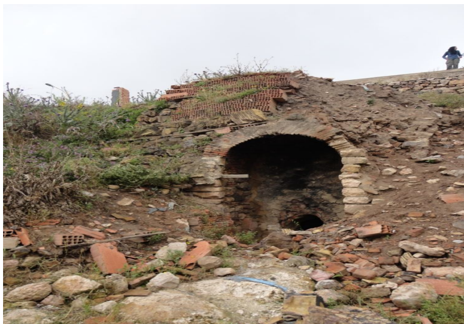
الفرن قبل التنظيف والترميم