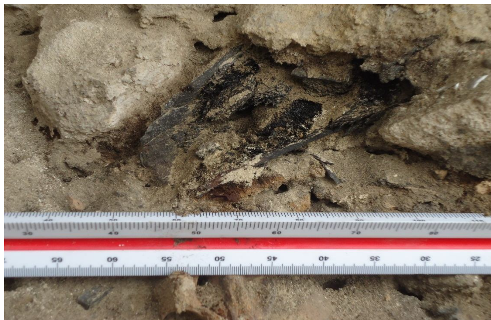
مناظر للربوة (طبقات من الشقف وبقايا من مواد الحرق للأفران)