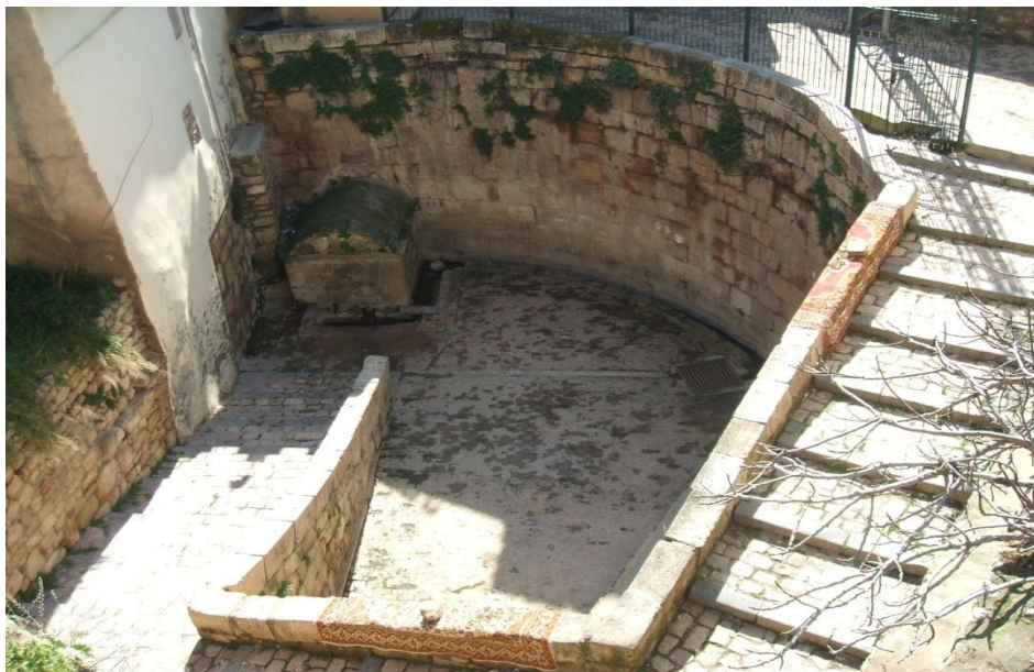
منظر عام لعين لبلاد (عين أبي السباع)