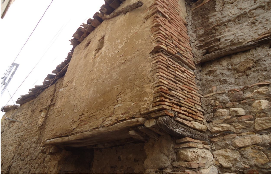
واجهة خارجية لمسكن ذو طابق مزين بروشن Encorbellement