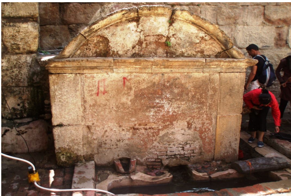
عين البلاد (عين أبي السباع)