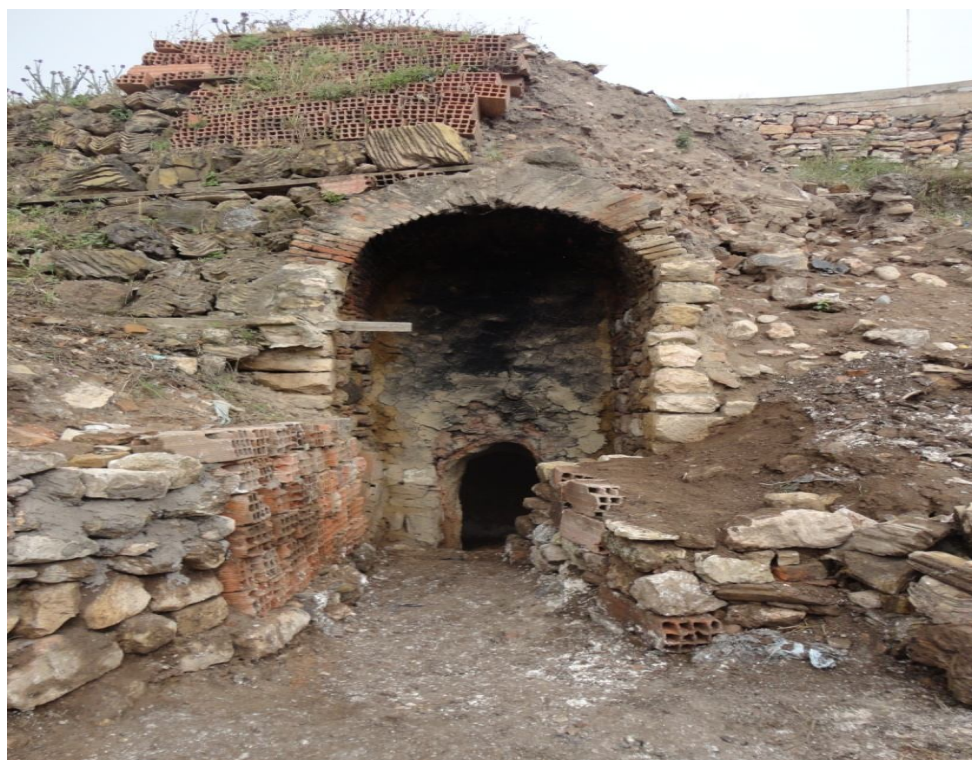
الفرن بعد التنظيف و الترميم (فتحة الموقد)