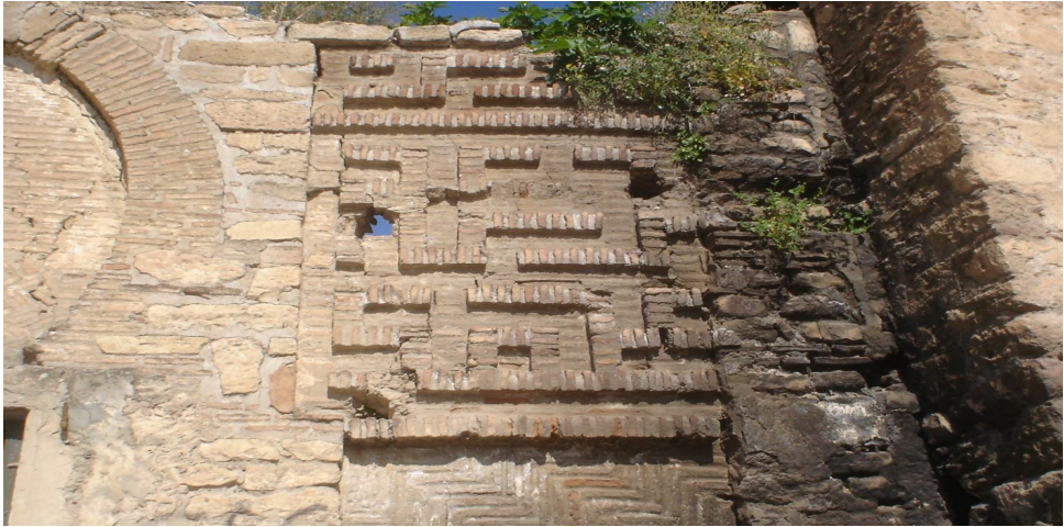
الواجهة الخارجية لدار الإمارة