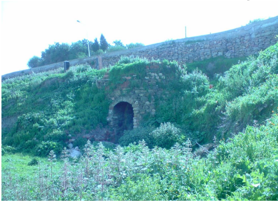
منظر عام لأحد الأفران

إن من خلال خرجاتنا الميدانية لمنطقة ميله استطعنا أن نسطر برنامجا علميا للقيام بأبحاث أكاديمية لدراسة المعالم و البقايا الأثرية التي تزخر بها المنطقة . كما قمنا بإنجاز برنامج وطني للبحث حول "المراكز الصناعية للفخار و الخزف في الجزائر" ويحدّدنا بالخصوص منطقة ميله نموذجا.