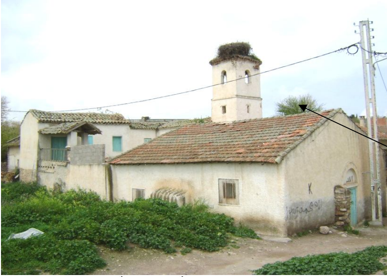
منظر عام للزاوية الرحمانية