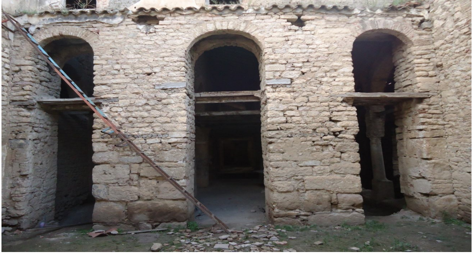
دار الإمارة منظر داخلي