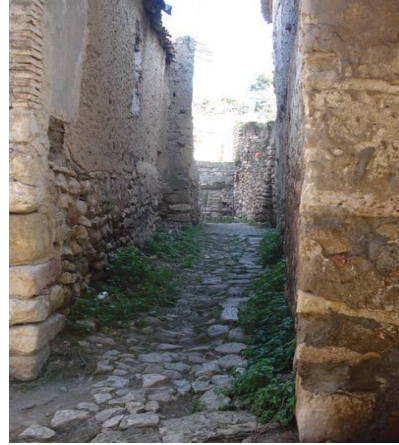
رواق مسقوف (السباط)