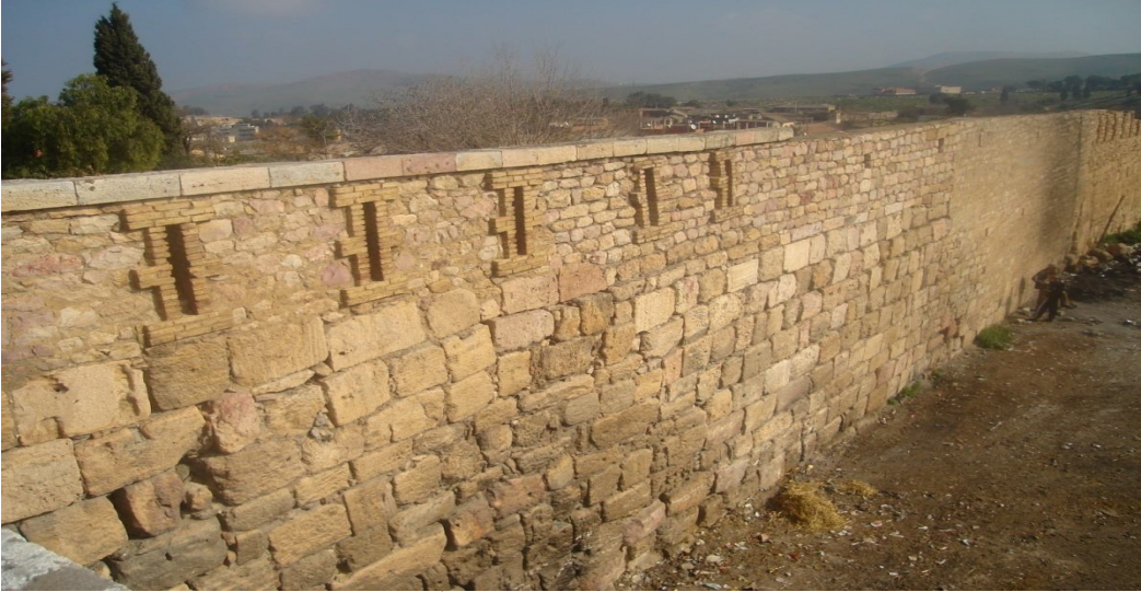
منظر داخلي لسور المدينة

برجا للمراقبة، ذات الشكل المربع، كما تخترق الأجزاء العلوية للسور المزاغل مستطيلة الشكل تستعمل للدفاع عن الهجومات الخارجية.