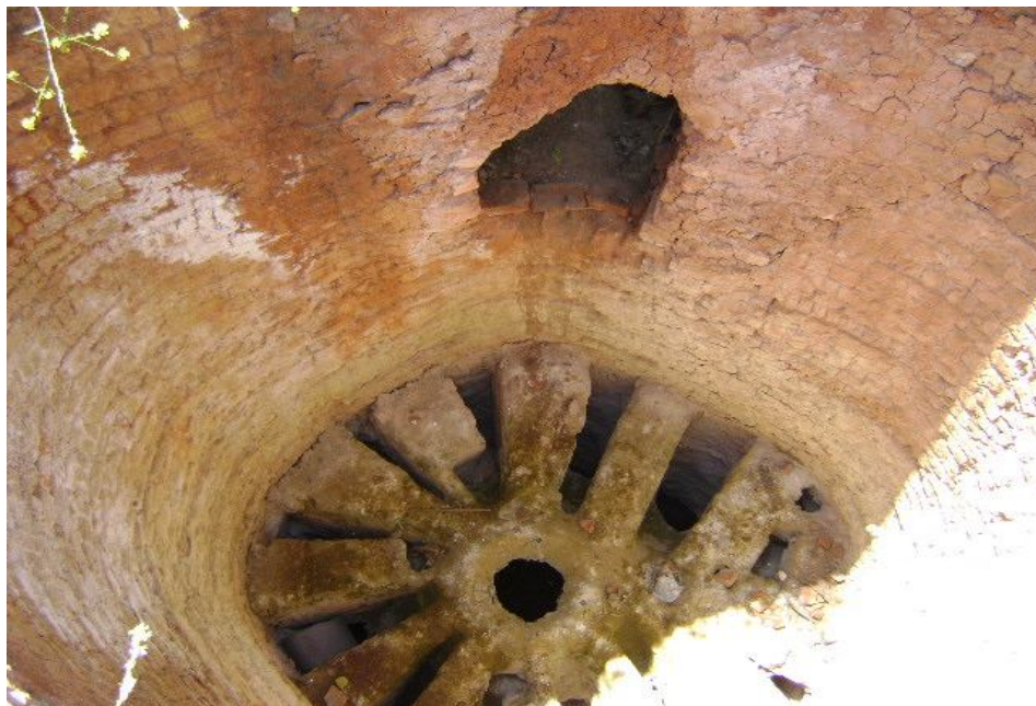
منظر لغرفة الحرق