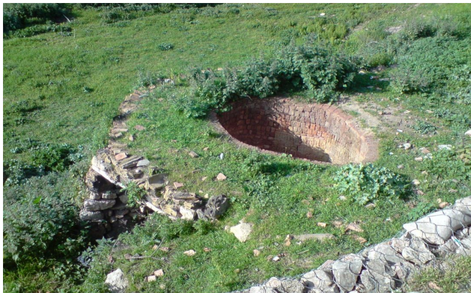
الجزء العلوي للفرن