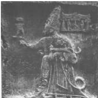
شكل ٤ : قرص الشمس المجنح كجزء من لقب الملك الحيثي