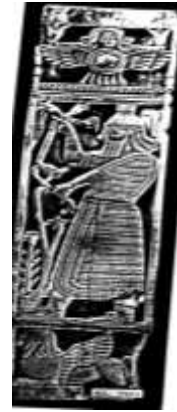
شكل ١٦ : رأس سيدة يعلو قرص الشمس المجنح عن : F.Basmachi,Treasures of : Iraq Museum ,pl.183.