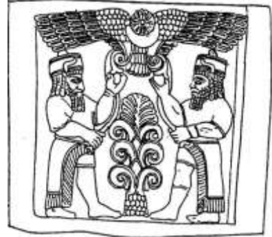
شكل ٩ : إثنان من المعبودات يمسكان طرفي حبل يتدلي من قرص الشمس المجنح عن: E.Akurgal, Die Kunst der Hethiter, Abb.134: