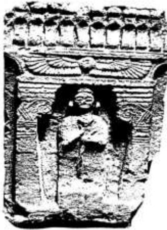
شكل ٧ : الإلهة بعلات داخل هيكل يتوجه قرص الشمس المجنح