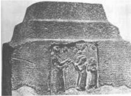
شكل ١٣ : نصف قرص مجنح علي المسلة المكسورة من نينوي من نقوش آشور ناصربال بأشور عن: H.Frankfort, op.cit.,p.134,fig.151: