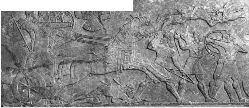
شكل ١١ : معبود في هيئة بشرية داخل قرص الشمس المجنح من نقوش آشور ناصربال عن: B.F.Batto ; K.L.Roberts ; J.J.Mc.Roberts , David and Zion: Biblical Studies in Honor of J.M.Roberts , Eisenbrauns 2004,p.153,fig.5.