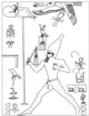
شكل ٢ : مشط الملك جت