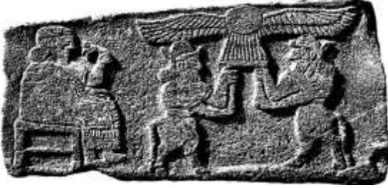
شكل ١٠ : جنيان في هيئة ثور برأس آدمي يرفعان قاعدة عليها قرص الشمس المجنح عن: B.M.Von Oppenheim, Tell Halaf,pl.XXIX:

عن: H.Frankfort , The Art and Architecture .fig.316