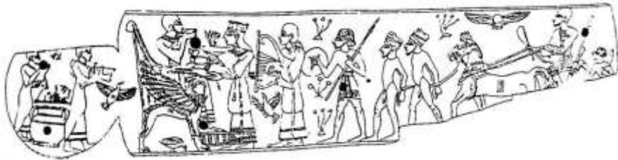
شكل ٨ : قرص الشمس المجنح يتوج عودة أمير منتصرا - نقش عاجي من مجدو