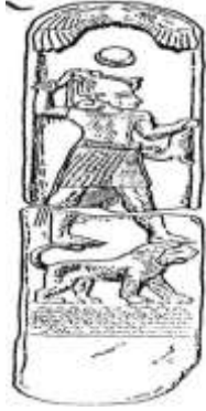
شكل ٦: لوحة المعبود يعل من ماراتوس عن: أبو المحاسن عصفور : المدن الفينيقية، ص ١٦٢