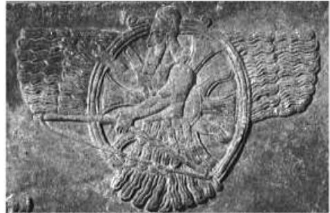
شكل ١٢ : تفصيل للهيئة البشرية داخل قرص الشمس المجنح B.F.Batto ; K.L.Roberts, op.cit., fig.7