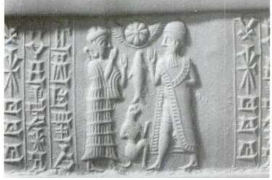
شكل ٥: ختم مترونا أبنة أبلاندا عن : Collon ,op.cit.,fig.43