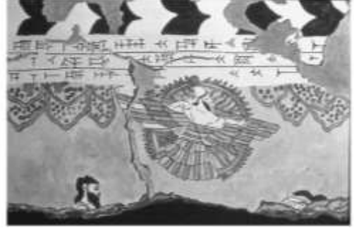
شكل ١٤ : قطعة قرميد مزجج من عهد الملك تيكلوت نينورتا عن: B.F.Batto ; K.L.Roberts,op.cit., fig.1