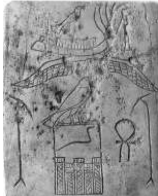
شكل ١: اسم pHdt علي أحد لوحات جسر