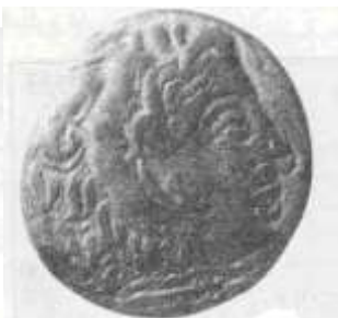
"الإسكندر الأكبر" (٢٢ - أ)