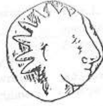
الإله "هليوس" (٩ - أ)