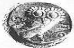
البومة (٢ - ب)

Mnuro-Hay S. C., Coins of Ancient South Arabia II , op. cit., pl. 12.