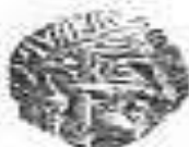
الإلهة "أثينا" (٣ - أ)