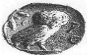
البومة (١ - ب)