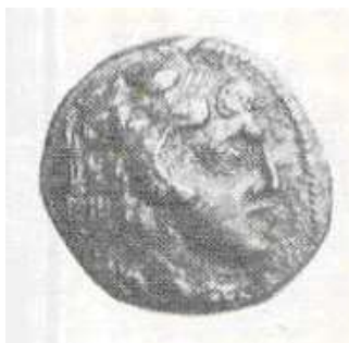
"الإسكندر الأكبر" (٢٠ - أ)