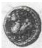
نسر (٢٤ - ب)