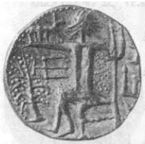
الإله "زيوس" (٢٣ - ب)