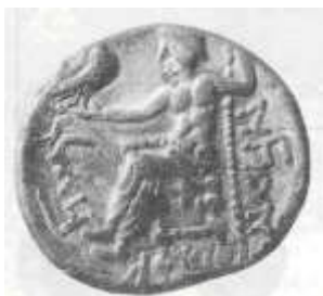
الإله "زيوس" (٢٢ - ب)