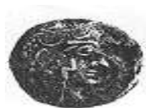
البيومة (٧ - ب)