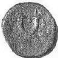
قرن الخيرات (١٩ - ب)