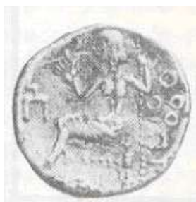
الإله "زيوس" (٢٠ - ب)