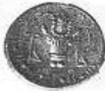
رأس ثور و بجانبه قرن الخيرات (١٢ - ب)