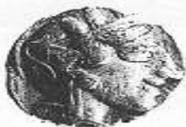
الإلهة "أثينا" (١ - أ)