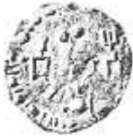
اليومة (١١ - ب)

Without Writer: Sylloge Nummorum Graecorum , op. cit., pl. 51.