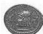
رأس لحاكم عربي (١٢ - أ)