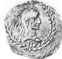
الإمبراطور "أغسطس" (١٠ - أ)