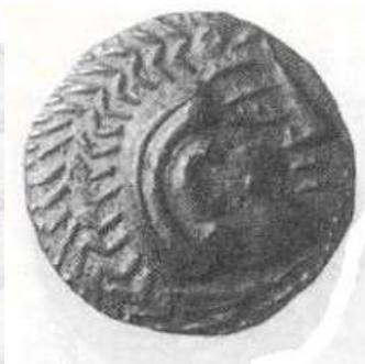
"الإسكندر الأكبر" (٢٣ - أ)