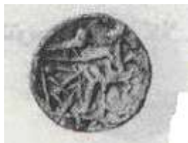
الإله "زيوس" (٢١ - ب)