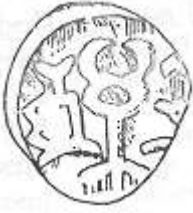
الكريكيون (٩ - ب)