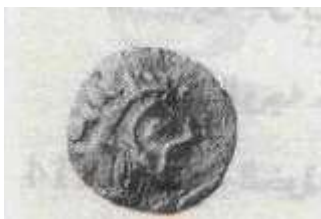
"الإسكندر الأكبر" (٢١ - أ)