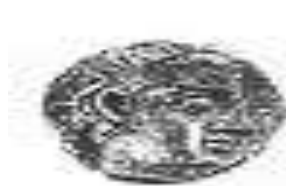
الإلهة "أثينا" (٦ - أ)