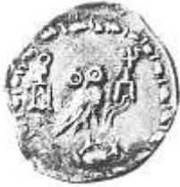
اليومة (١٠ - ب)

Sedov A. V. & Aydarus U., The Coinage of Ancient Hadramawt, "The pre-Islamic Coin in the al-Mukallâ Museum" , op. cit., p.18.