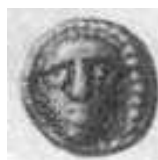
الإله "أبوللو" (٢٤ - أ)