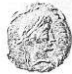
الإمبراطور "أغسطس" (١١ - أ)