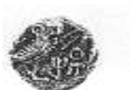
البيومة (٦ - ب)