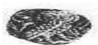
البيومة (٥ - ب)