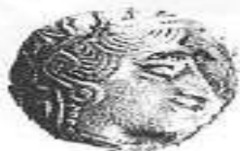
الإلهة "أثينا" (٢ - أ)