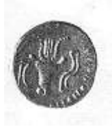
رأس ثور وبجانبه قرن الخيرات (١٣ - ب)