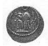
رأس لحاكم عربي (١٣ - أ)