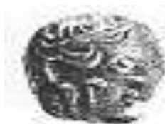
الإلهة "أثينا" (٥ - أ)