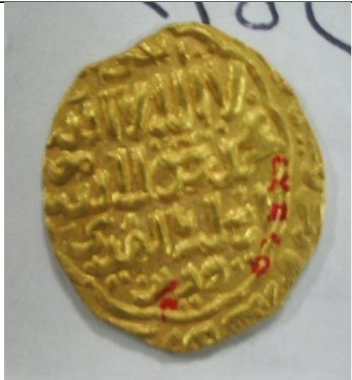
صورة رقم (٣) دينار للسلطان قلاوون بالكتابات المعتاده رقم سجل ١٢/٢٣٥٢٥ المتحف الإسلامي