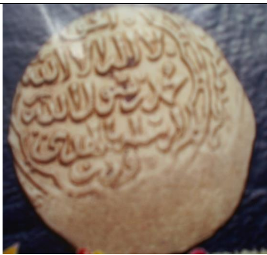
صورة رقم (٢) دينار المنصور قلاوون متحف الفن الإسلامي رقم سجل ١٥/١٤٧١٣