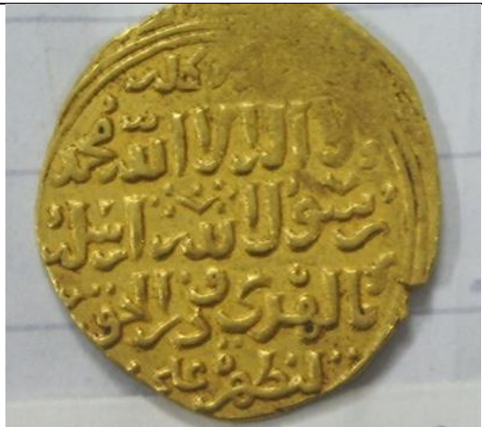
صورة رقم (٤) دينار الاشرف خليل - متحف الفن الإسلامي رقم سجل ١٨/١٤٧١٣