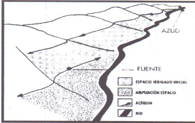
٤- طريقة استغلال الإحتذار و توزيع الماء على المساحات الموازية لموارد المنبع في جزيرة ميورقة.

BARCELÓ M., KIRCHNER, H. & NAVARRO C., El agua que no duerme: fundamentos de la arqueología hidráulica andalusí, El legado andalusí , Sierra Nevada, 1995, p. 95.