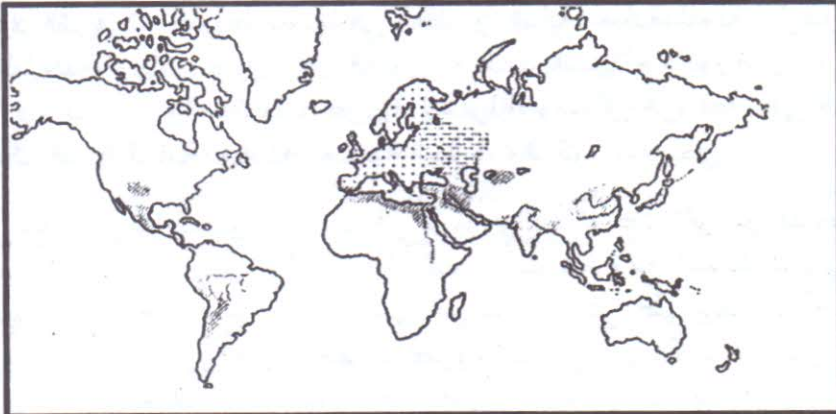
١- خريطة تمثل ما يسمى "المجتمعات المائية" في القرن ١٥م حسب كارل فيتفوجل

هذه الرؤية أثرت في العديد من الدراسات الاجتماعية والتاريخية الساعية لفهم طبيعة المجتمعات الزراعية وكيفية تدبيرها للمنشآت المائية. في الحقيقة هذه المقاربات النمطية الكبرى بصمت بشكل كبير الأبحاث الإثنوغرافية والأثرية الأمريكية لكل من (ج.مشيوارت ر.ماك أدامس، أ.بالرمو...) قبل أن تنتسج إلى أعمال وفضاءات جغرافية جديدة.