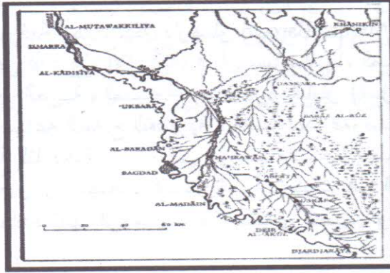
٢- شبكة السقي والمنشآت المائية في أرباب بغداد (٦٣٧-١٥٠٠م)