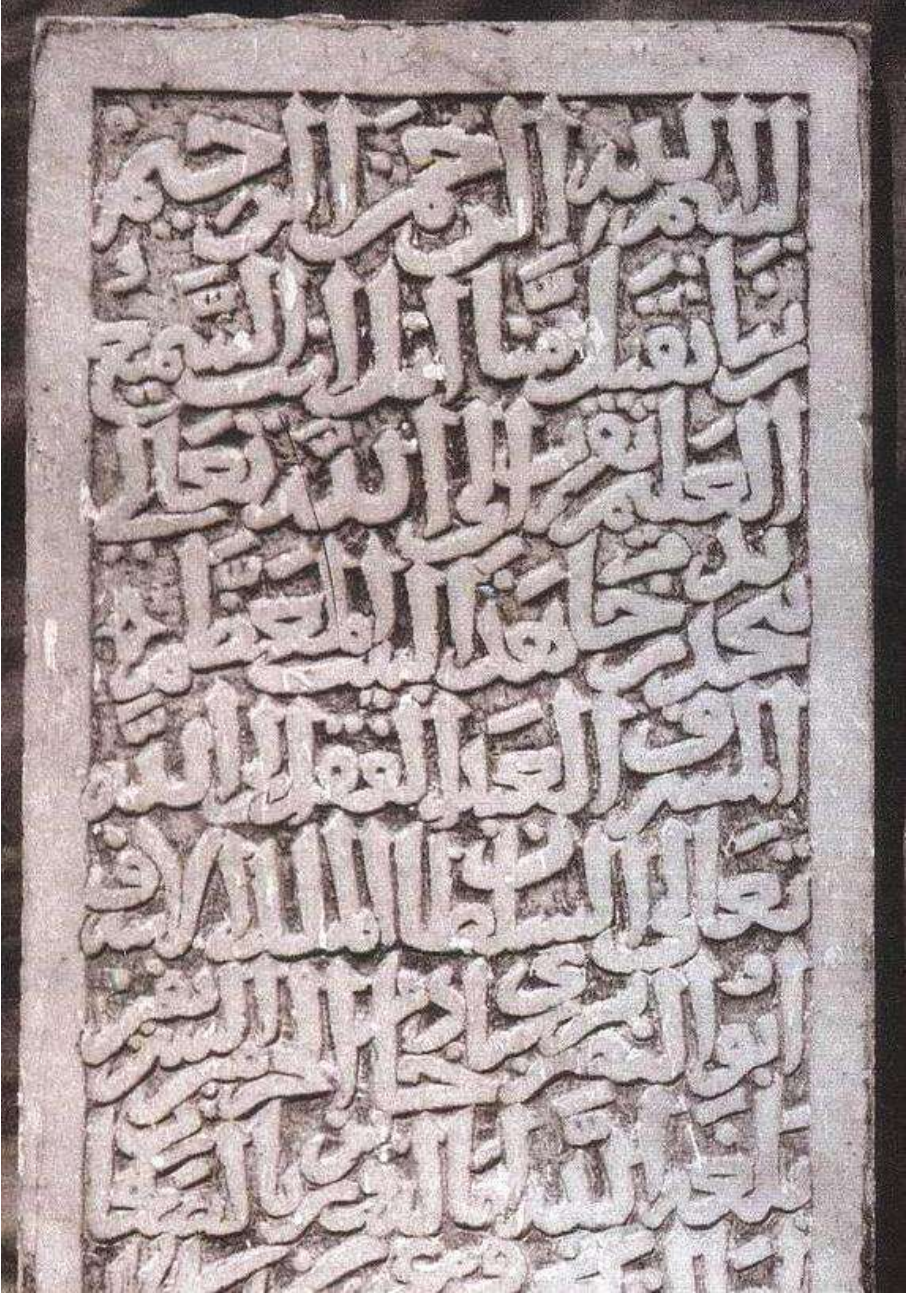
لوحة (٢) نقش السلطان الأشرف برسباي المؤرخ بسنة ٨٢٦هـ/١٤٢٣م، والمحفوظ داخل الكعبة المشرفة.