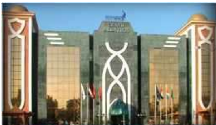
(لوحة ٢٣) فندق الباتروس في بورسعيد