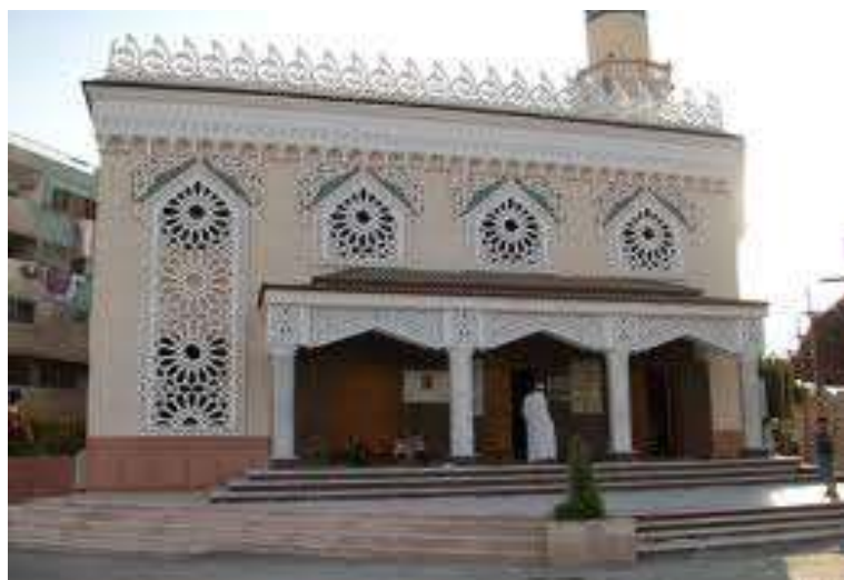
(لوحة ٤) الجامع العباسي في الإسماعيلية