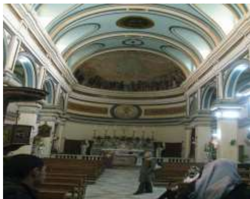
(لوحة ١٢) الجناح الأوسط في كنيسة أوجيني في بورسعيد

(شكل ٢) خريطة توضح معالم بورسعيد وموقع بورفؤاد في قارة آسيا