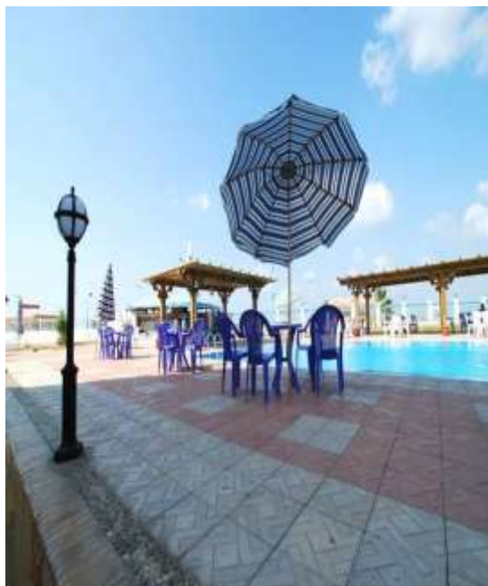
(لوحة ٢٢) قرية النورس في بورسعيد