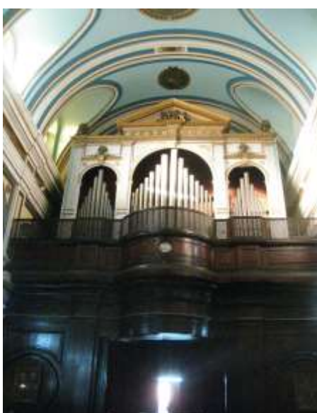
(لوحة ١٣) الجناح الأيمن في كنيسة أوجيني في بورسعيد