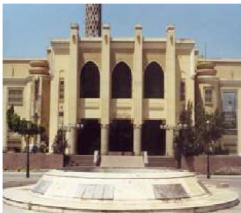
(لوحة ٢٠) متحف النصر للفن الحديث في بورسعيد