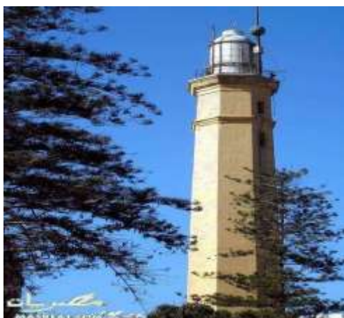
(لوحة ١٧) فانار بورسعيد الحديث