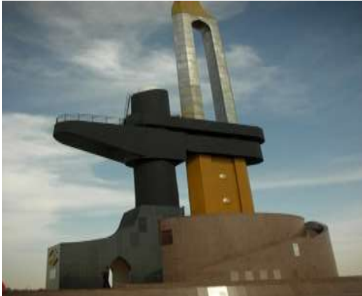
(لوحة ٩) النصب التذكارى فى الإسماعيلية