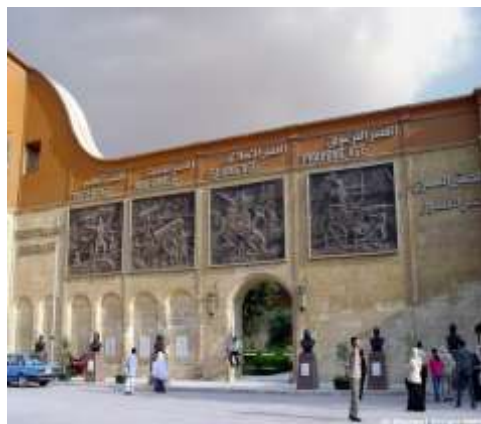
(لوحة ١٩) المتحف الحربى في بورسعيد