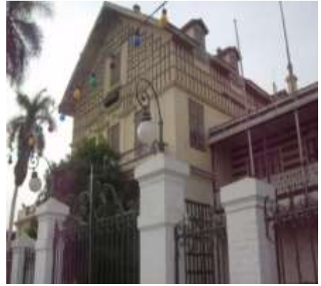
(لوحة ٦) متحف ديلسبس فى الإسماعيلية