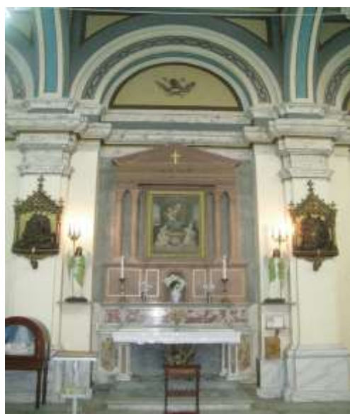
(لوحة ١٤) الجناح الأيسر في كنيسة اوجيني