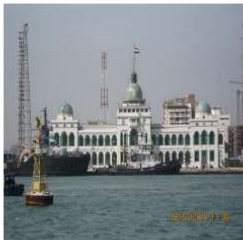
(لوحة ١٥) مبنى هيئة قناة السويس "القبة"