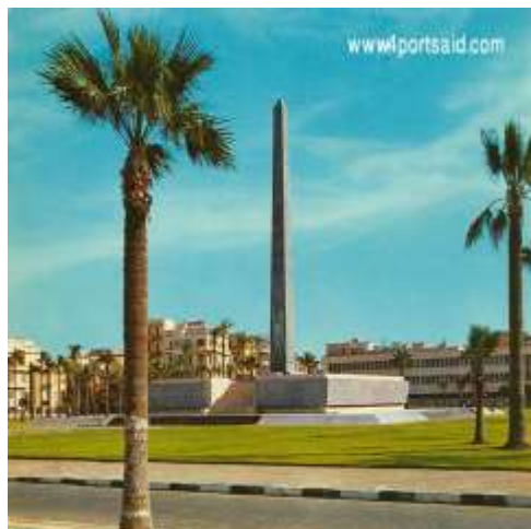
(لوحة ١٦) النصب التذكري في بورسعيد