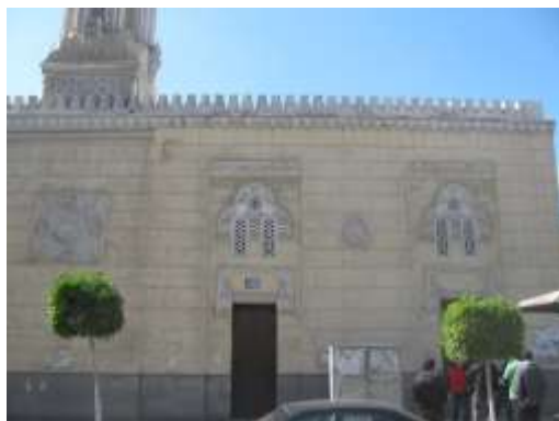
(لوحة ١١) جامع العباسي في بورسعيد