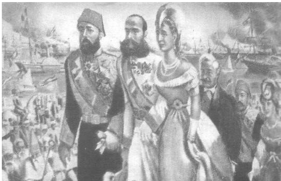
(لوحة ٢) الملكة اوجيني والخبوي إسماعيل والامبراطور نابليون