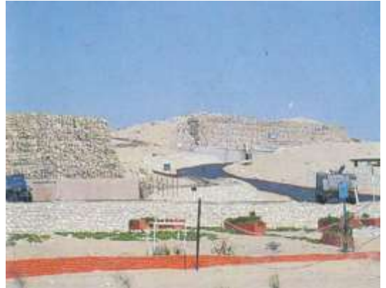
(لوحة ٨) تبة الشجرة فى الإسماعيلية