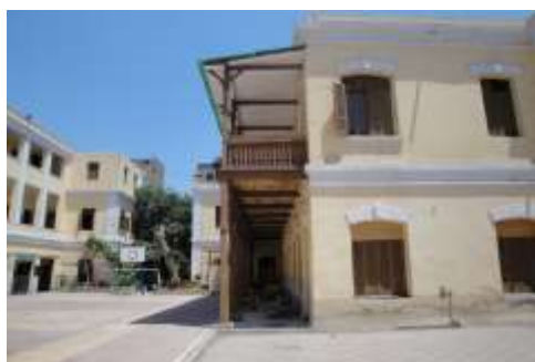
اللوحة رقم (٩) الواجهة الجنوبية للمبنى الثاني