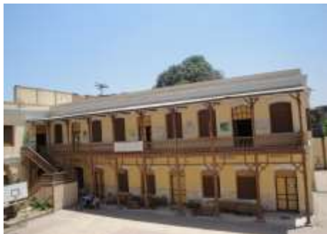
٨- الواجهة الغربية بالمبنى الثاني من الواجهة الشرقية بالمبنى الثاني