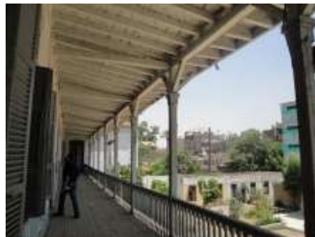
اللوحة رقم (٧) البانكة التي تتقدم الطابق الثاني.