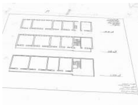
الشكل رقم ٢