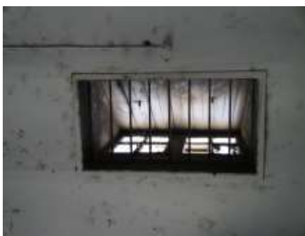
اللوحة رقم (٦) ملقف الهواء بالمبنى الثاني