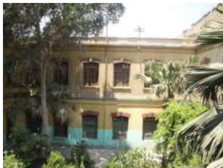
اللوحة رقم (٥) الواجهة الشرقية