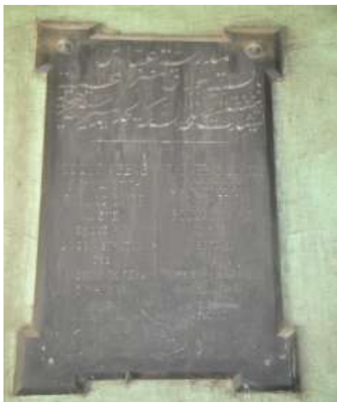
٢- (النص التأسيسي)