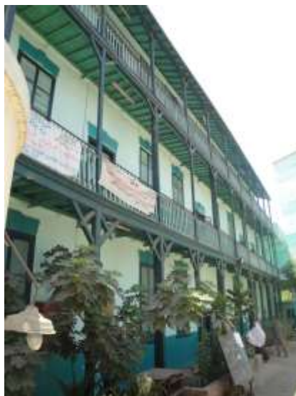
(١) الواجهة الغربية من المبنى الأول