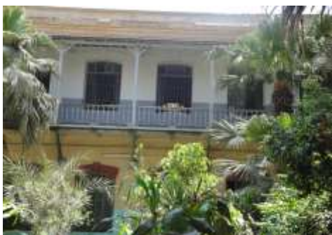
٣ النافورة التي تتوسط الصحن المكشوف بداخل المبنى الثاني. ٤ - الواجهة الشرقية للمبنى