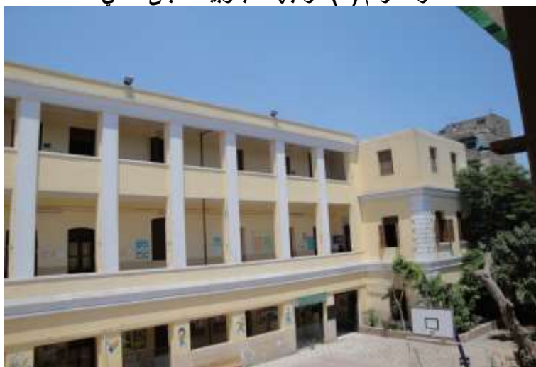
اللوحة رقم (١٠) الواجهة الشرقية للمبنى الثالث