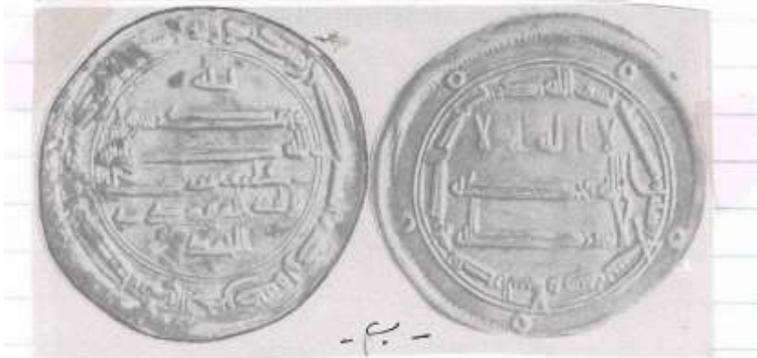
درهم للخليفة المهدي سنة ١٦٩ هجرية حمل عبارة (الله الحمد)

من هنا نلاحظ أهمية النقود في حياة الخليفة الجديد وذلك لاشعار العامة والخاصة من الناس بأنه هو الخليفة وليس شخصاً آخر . ومن الدراهم التي سكّت بمناسبة النصر الذي حققه الخليفة المهدي على الزنادقة في نهاية سنة ١٦٨ هجرية ، حيث حملت دراهم قصر السلام سنة ١٦٩ هجرية عبارة (الله الحمد) وذلك تخليداً للنصر الذي تحقق على الزنادقة ، وبذلك كانت تلك الدراهم تمثل دوراً اعلامياً (٨) .