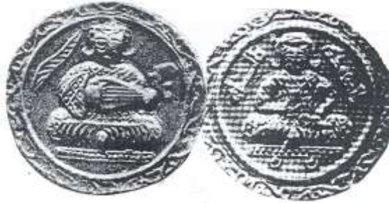
نقد صلة للخليفة العباسي المقتدر بالله

وقد سكت مسكوكة اخرى للمناسبة في عهد الخليفة العباسي المقتدر بالله ٢٩٥ - ٣٢٠ هـ نقش على الوجه صورة للخليفة جالس متربع على تخت واطى ويمسك بيده اليمنى المرفوعة الى صدره كأساً ، وييده الاخرى منديلاً ، ونقش فوق رأسه عبارة (المقتدر بالله) ويبدو على الخليفة وهو بملابس فاخرة . اما الجانب الثاني لهذا نقد الصلة فقد حملت صورة امرأة ويدها الة العود وتجلس متربعة على تخت واطى . وهذا النقد المصور المهم محفوظ اليوم بمتحف برلين بالمانيا ، والنقد غير مؤرخ لذلك من الصعب معرفة المناسبة التي سكت فيها .