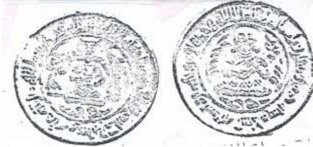
نقد صلة للخليفة العباسي الطائع لله وعز الدولة البويهبي

بملايس فضاضة ويحمل بيده اليمنى كأس وفي يده اليسرى غصن نباتي وتقف على جانبيه جاريتان تعزفان وعلى الطوق كتابة نصها (لا اله الا الله محمد رسول الله صلى الله عليه وسلم الطائع لله الأمير عز الدولة) . وعلى الظهر لهذا النقد المصور تظهر عازفة احتضنت العود وعلى جانبيها غصنين من اغصان شجرة الزيتون ، وعلى الطوق كتابة نصها (لا اله الا الله وحده لا شريك له ضرب بمدينة السلام سنة خمس وستين وثلاثماية) (١٩) .