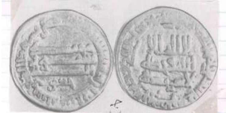
أول دينار ذهبي حمل أسم (جعفر) ابن الهادي سنة ١٧٠ هجرية وهو أول دينار حمل أسم ولي العهد

ومن عصر الخليفة العباسي (الخليفة الهادي ١٦٩ - ١٧٠هـ) وعلى الرغم من قصر فترة خلافته فقد نقش اسم وزيره (ابراهيم) وهو ابراهيم بن ذكوان الحراني على دراهم مدينة السلام للسنتين ١٦٩ و ١٧٠هـ (٩) . كما نقش الخليفة الهادي اسم ولده (جعفر) على دنانير سنة ١٧٠ هجرية عندما خلع اخيه هارون من منصب ولاية العهد ونصب ابنه (جعفر) وله من العمر خمس سنوات وبذلك يكون جعفر اول ولي عهد ينقش على الدنانير الذهبية (١٠) .