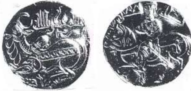
نقد صلة للخليفة العباسي المقتدر بالله

ان هذا النقد المصور غير مؤرخ مما يصعب معرفة المناسبة التي سك بها، وقد يكون يخلد انتصاراً للخليفة المقتدر بالله على مؤنس المظفر قائد جيوشه عندما خرج عن طاعته وذلك سنة ٣٢٠ هجرية او ربما يخلد انتصاراً على اعدائه او ربما يخلد مناسبة اجتماعية معينة .