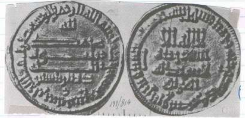
دينار حمل اسم (العراق) سنة ١٩٩ هجرية من عهد الخليفة المأمون ١٩٨-٢١٨ هجرية

ولم يصلنا منها وقد تكون مثل تلك النقود قد صهرت بعد مقتل الخليفة الأمين سنة ١٩٨ هجرية ، من قبل الخليفة الجديد المأمون (١٤) . وقد سك الخليفة المأمون دنانير حملت اسم (العراق) سنة ١٩٩ هجرية انظر لوح ٣ ج .