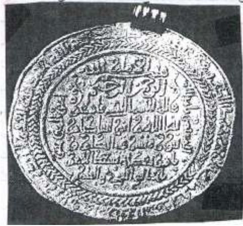
نقد صلة للخليفة العباسي المستضئ بالله

الطوق الثاني : شريط كتابي بالخط الكوفي الجميل يتضمن آية الكرسي وهي (الله لا اله الا هو الحي القيوم لا تأخذه سنة ولا نوم له ما في السموات وما في الارض من ذا الذي يشفع عنده الا بأذنه .