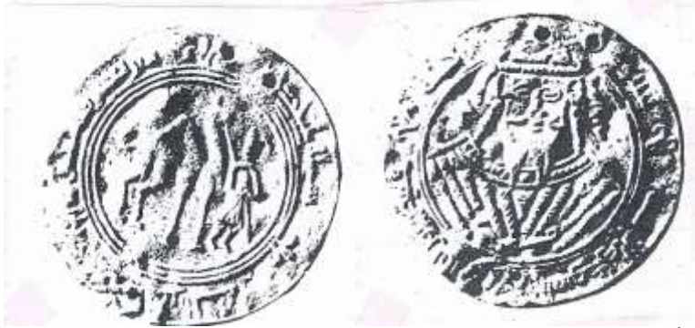
أول نقد فضي عباسي مصور من عهد الخليفة المتوكل على الله

ومن اهم نقود الصلة والمناسبات التي ظهرت في العصر العباسي هو درهم الصلة للخليفة العباسي المتوكل على الله ٢٣٢ - ٢٤٧هـ / ٨٤٧ - ٨٦١ م) . انظر لوح