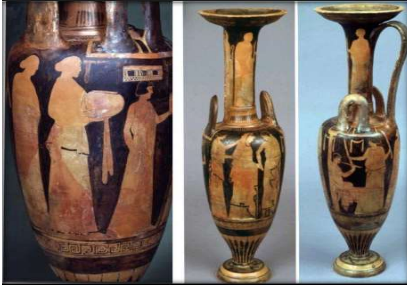
(لوحة ١٤) أمفوروس لوتروفوروس - مشهد موكب الزفاف

https://www.ancient-origins.net/artifacts-other-artifacts/ Accessed on: 2/12/2022 4:40 p.m.