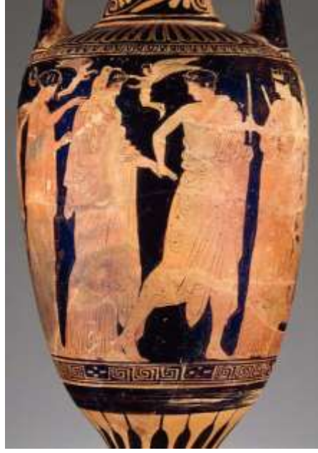
(لوحة ١٣) أمفوروس لوتروفوروس - استقبال العريس للعروس إلى منزل الزوجية