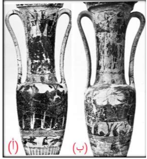
(لوحة ٦) أمفوروس-هيدريا مشهد جنازي

http://www.mfa.org/collections/object/bathing-vessel-loutrophoros-depicting-a-bridal-procession-153797