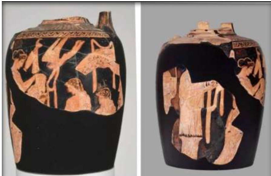
(لوحة ١٢) أمفوروس لوتروفوروس - لحظة استقبال العريس للعروس - رفع حجاب العروس

https://www.ancient-origins.net/artifacts-other-artifacts/