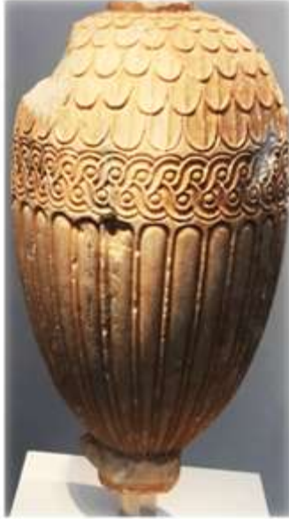
(لوحة ٩) شاهد قبر- أمفوروس هيدريا- زخارف هندسية www.europeana.eu/