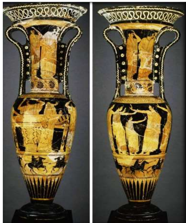
(لوحة ٤) أمفوروس-هيدريا مشهد جنازى للمتوفى