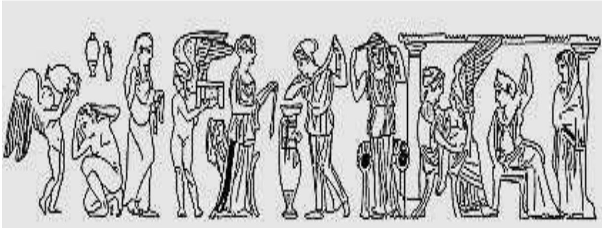
(شكل ١) لوحة توضح استخدام أواني اللوتروفوروس في تنقية العروس قبل الزفاف

https://www.ancient-origins.net/artifacts-other-artifacts