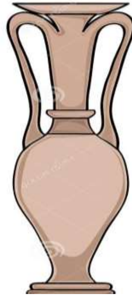
(شكل ٢) لوحة توضح الشكل العام لإناء اللوتروفوروس

https://www.ancient-origins.net/artifacts-other-artifacts/