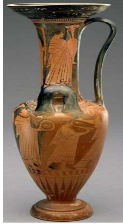
(شكل ٤) Loutrophoros-hydria - مزود بمقبض طويل