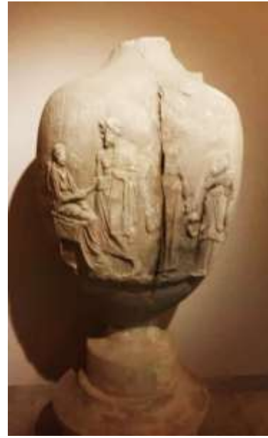
(لوحة ٨) شاهد قبر- أمفوروس لوتروفوروس- مشهد وداع العروس من والديها