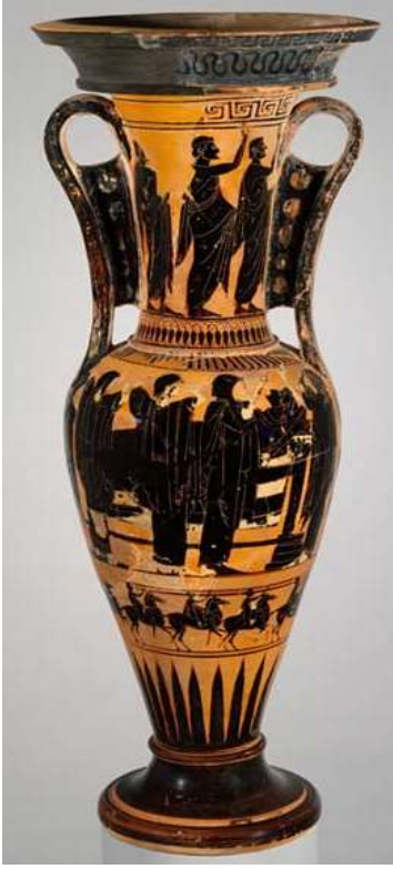
(لوحة ١) أمفوروس-هيدريا مشهد جنازي

https://www.ancient-origins.net/artifacts-other-artifacts/