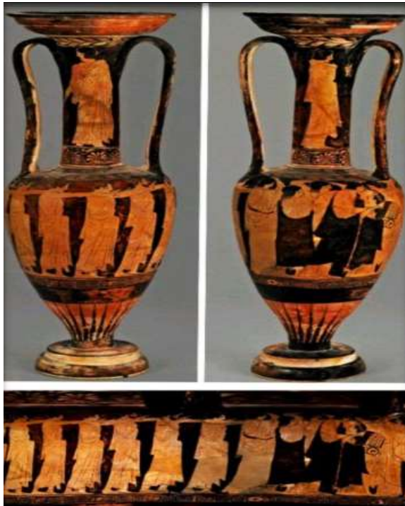
(لوحة ٥) أمفوروس-هيدريا مشهد جنازى - نزول المتوفى