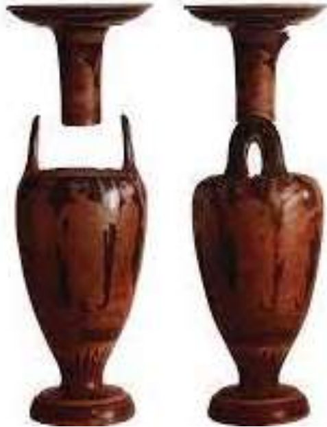
(شكل ٣) Lotrophoros-amphora - مزود بمقبضين يمر