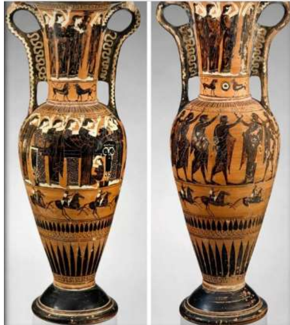
(لوحة ٢) أمفوروس-هيدريا مشهد جنازي للمتوفي

http://www.metmuseum.org/art/collections/