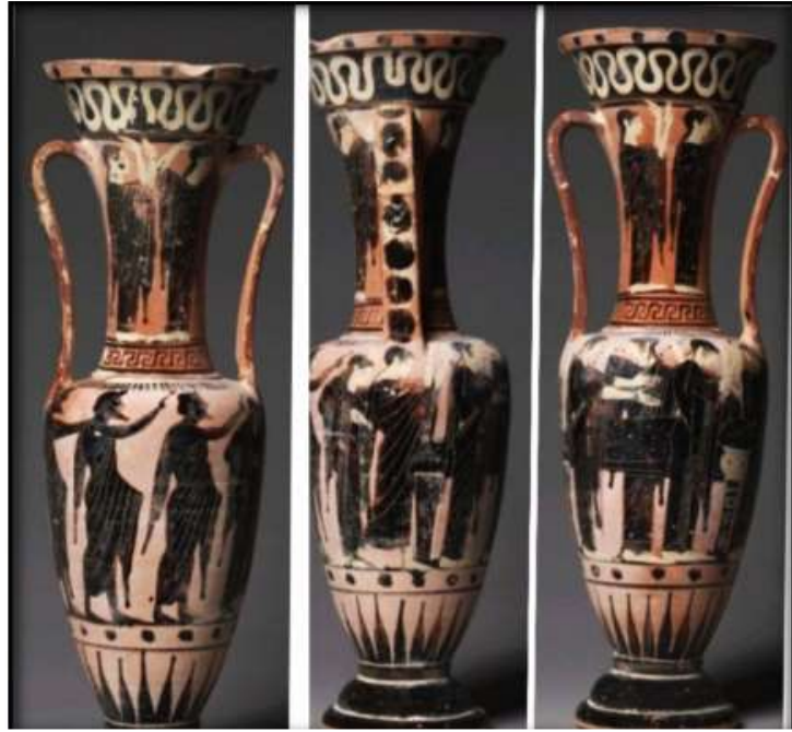
(لوحة ٣) أمفوروس-هيدريا مشهد جنازى للمتوفى

http://www.metmuseum.org/art/collections/