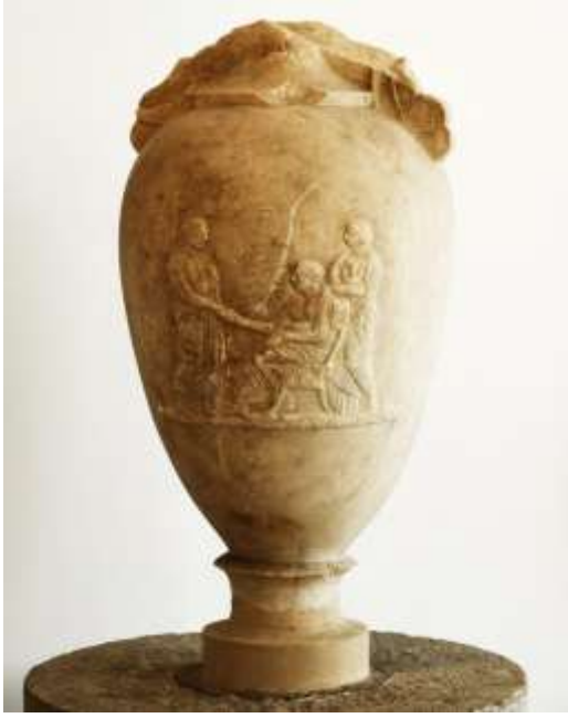
(لوحة ٧) لوتروفوروس هيدريا- شاهد قبر - لحظة وداع العروس من والديها