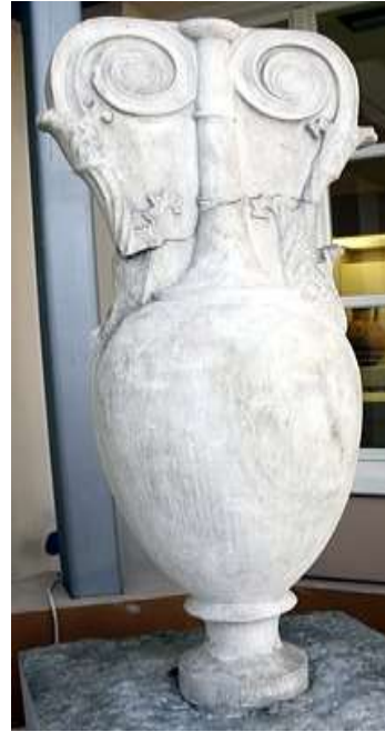
(لوحة ١٠) شاهد قبر - أمفوروس هيدريا- بدون زخارف

http://www.mfa.org/collections/object/bathing-vessel-loutrophorosdepicting-a-bridal-procession-153797 Accessed on :2/12/2022 3:36 am.