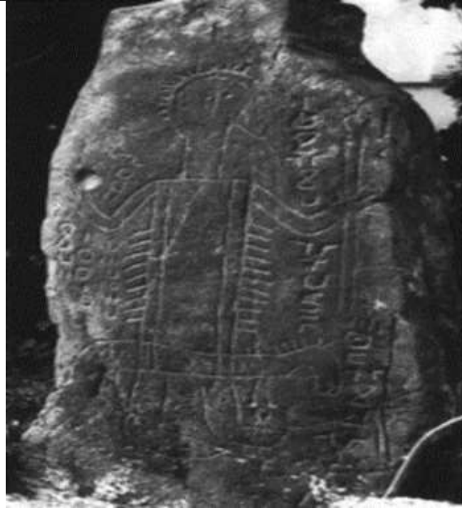
(شكل ٤) نقش كرفلة الواجهة الأمامية

CHAKER, « Kerkala », In Encyclopédie berbère , TOME XVII, 4158.