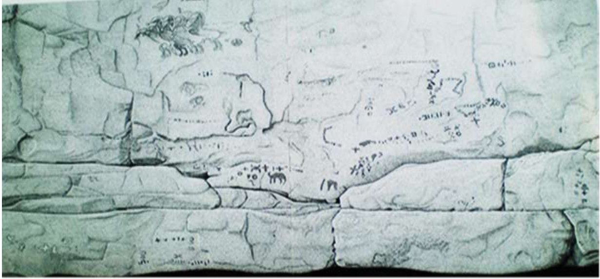
(شكل ٦) كتابة الليبية من منطقة الطاسيلي.

HACHID, Les premiers Berbères, Entre Méditerranée, Tassili et Nil , 174.