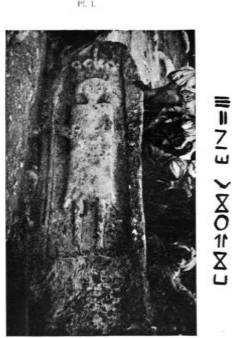
(شكل ١) نقش المنهير

AUGUSTE VEL, M., «Dans les ruines de tir-kabbine», In Recueil des notices et mémoires Société archéologique, historique et géographique , 1905, PL1.