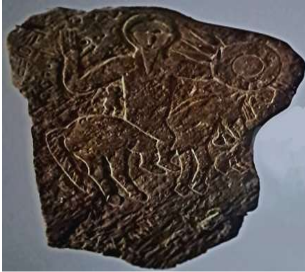
(شكل ٣) نقش تيديس

المتحف الوطني سيرتا، الجزائر النوميديّة، الجزائر: عاصمة الثقافة العربية، ٢٠٠٩م، ٢٠٢.