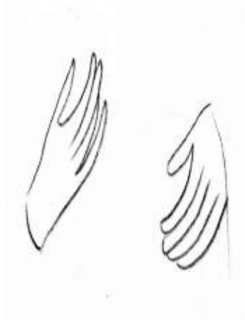
(شكل ٢) توضيح لوضع يد السيدة العذراء (أيقونة ٢) ©عمل الباحثة