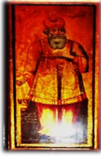
( لوحة ٥ ) أيقونة النبي زكريا بالهيكل الأوسط كنيسة الملاك ميخائيل القبلي