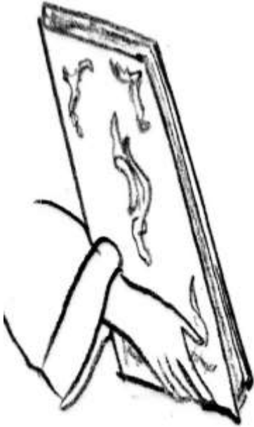
(شكل ١٢) توضيح للكتاب بيد تلاميذ السيد المسيح © عمل الباحثة