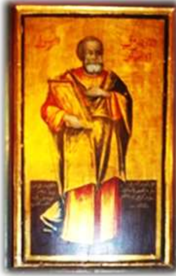
(لوحة ١٨) القديس متى الأنجيلي بالجانب الأيسر من الهيكل الأوسط بكنيسة الملاك ميخائيل القبلي