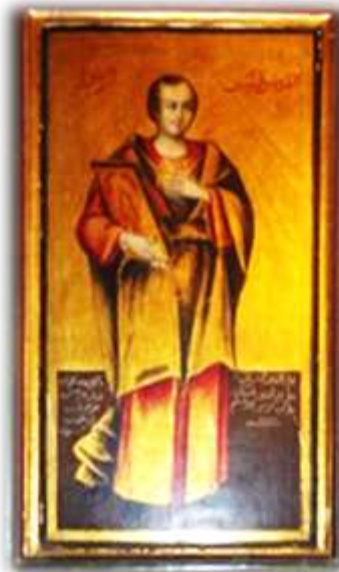
(لوحة ١٩) القديس فيلبس الرسول بالجانب الأيسر من الهيكل الأوسط بكنيسة الملاك ميخائيل القبلي