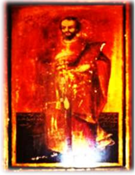
( لوحة ٩ ) أيقونة برثلموس الرسول بالجانب الأيمن من الهيكل الأوسط بكنيسة الملاك ميخائيل القبلي