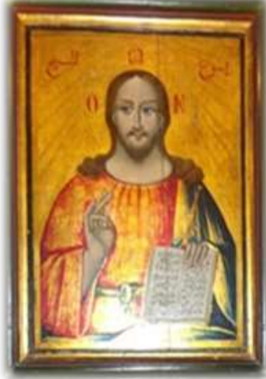
(لوحة ١) أيقونة السيد المسيح بحضن الآب بالهيكل الأوسط بكنيسة الملاك ميخائيل القبلي