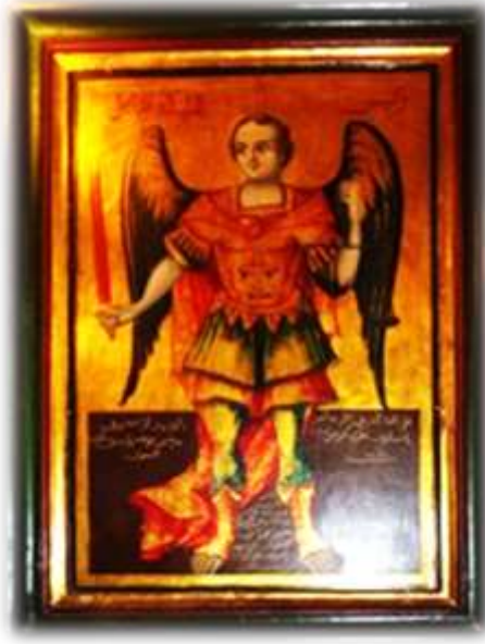
(لوحة ٣) أيقونة الملاك ميخائيل بحضن الآب بالهيكل الأوسط بكنيسة الملاك ميخائيل القبلي