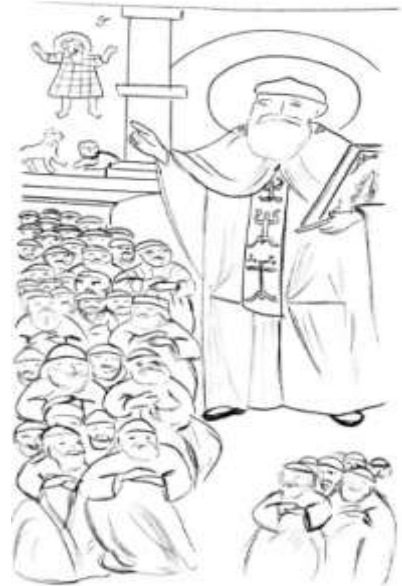
(شكل ١٠) رسم يوضح تفاصيل الأيقونة ب (اللوحة ٧) © عمل الباحثة