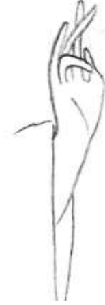
(شكل ١) رسم توضيحي لعلامة البركة بيد السيد المسيح ب(أيقونة ١) ©عمل الباحثة