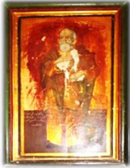
( لوحة ١٠ ) أيقونة تداوس الرسول بالجانب الأيمن من الهيكل الأوسط بكنيسة الملاك ميخائيل القبلي