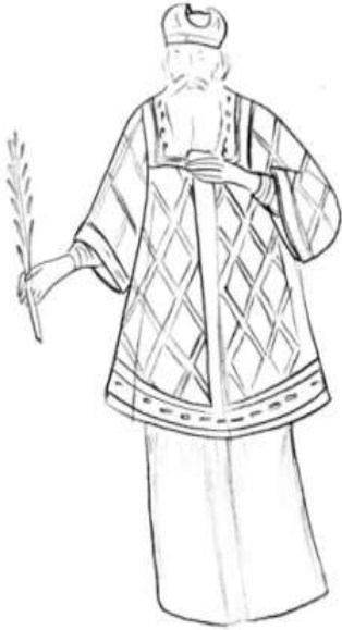
(شكل ٦) رسم توضيحي لأيقونة النبي هارون ب(اللوحة ٤) ©عمل الباحثة