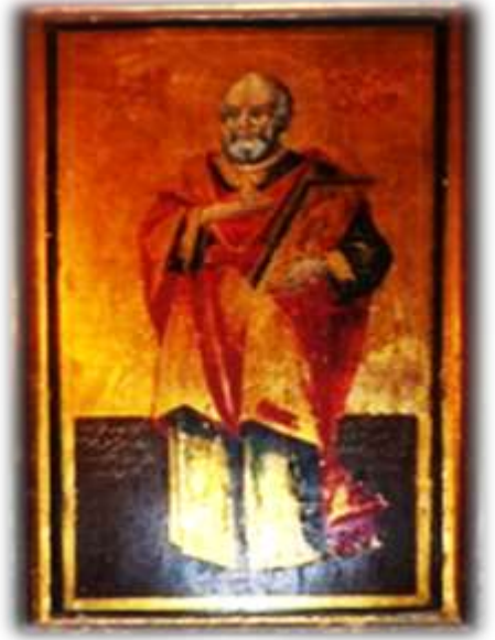
( لوحة ١٢ ) يوحنا الأنجيلي الرسول بالجانب الأيمن من الهيكل الأوسط بكنيسة الملاك ميخائيل القبلي