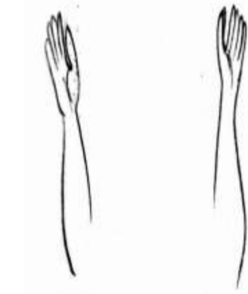
(شكل ٨) يوضح وضع اليد بأيقونة الأنبا بولا ب (اللوحة ٦)