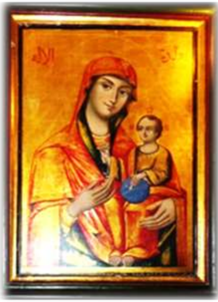
(لوحة ٢) أيقونة السيدة العذراء تحمل السيد المسيح بحضن الآب بالهيكل الأوسط بكنيسة الملاك ميخائيل القبلي