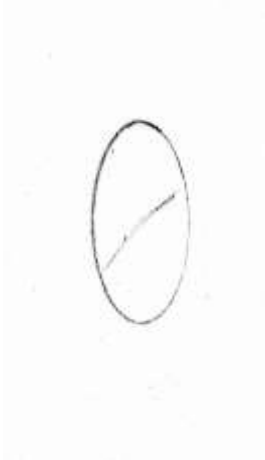
(شكل ٣) رسم توضيحي لشكل الرمز المستدير في يد السيد المسيح ب(اللوحة ٢) ©عمل الباحثة