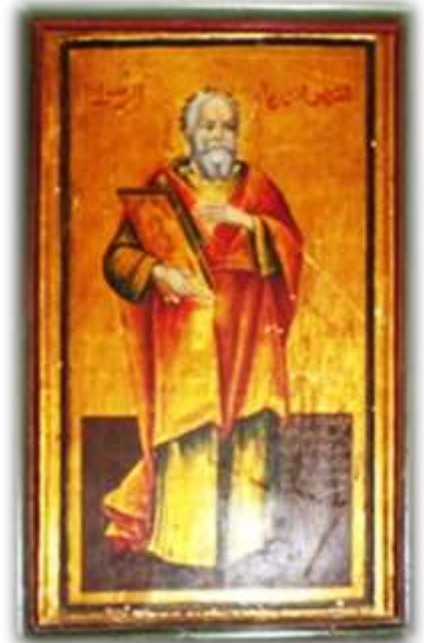
( لوحة ١٦ ) القديس اندراوس الرسول بالجانب الأيسر من الهيكل الأوسط بكنيسة الملاك ميخائيل القبلى