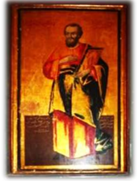
( لوحة ١١ ) أيقونة يعقوب ابن حلفا بالجانب الأيمن من الهيكل الأوسط بكنيسة الملاك ميخائيل القبلي