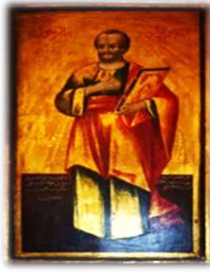
( لوحة ١٣ ) بولس الرسول بالجانب الأيمن من الهيكل الأوسط بكنيسة الملاك ميخائيل القبلى