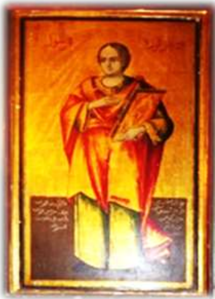
( لوحة ٨ ) توما الرسول بالجانب الأيمن من الهيكل الأوسط بكنيسة الملاك ميخائيل القبلي