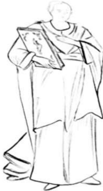
(شكل ١١) توضيح لملابس التلميذ ب (اللوحة ٨) © عمل الباحثة