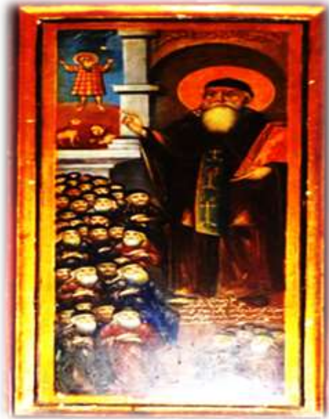
( لوحة ٧ ) الأنبا أنطونيوس بالهيكل الأوسط كنيسة الملاك ميخائيل القبلي