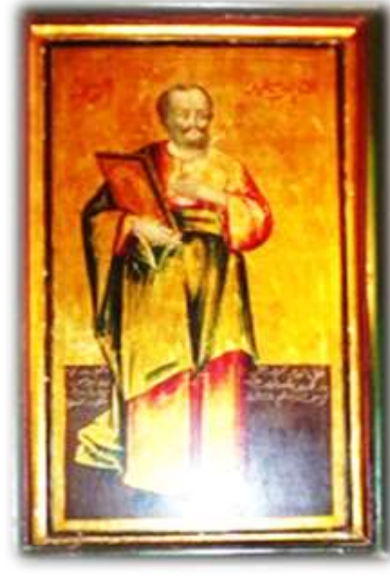
( لوحة ١٥ ) القديس سمعان بالجانب الأيسر من الهيكل الأوسط بكنيسة الملاك ميخائيل القبلى