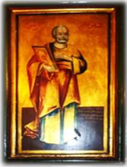
( لوحة ١٤ ) بطرس الرسول بالجانب الأيسر من الهيكل الأوسط بكنيسة الملاك ميخائيل القبلى