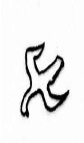
(شكل ٩) لرسم الغرب (لوحة ٦) © عمل الباحثة