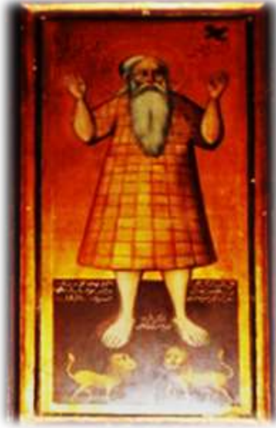
( لوحة ٦ ) أيقونة الأنبا بولا بالهيكل الأوسط كنيسة الملاك ميخائيل القبلي