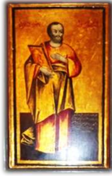
(لوحة ١٧) القديس يعقوب بن زدى بالجانب الأيسر من الهيكل الأوسط بكنيسة الملاك ميخائيل القبلي