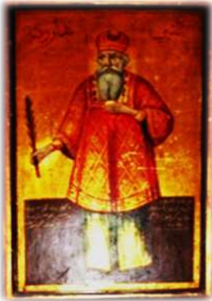
(لوحة ٤) أيقونة النبي هارون على يمين الداخل إلى الهيكل الأوسط بكنيسة الملاك ميخائيل القبلي