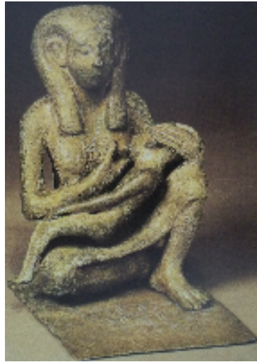
Fig.1 : Femme nourricière de la Moyenne Empire, cuivre, Musée de Berlin (14078).

R.Schulz, M.Seidel, Egypt the world of the Pharaohs , China, 2007, p. 409.