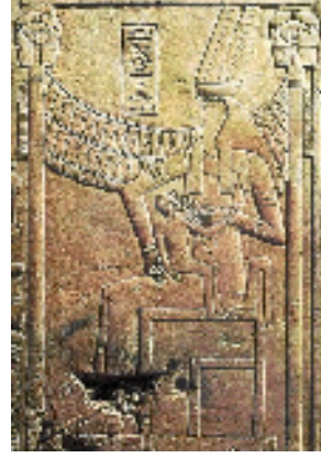
Fig.6 : La déesse Rénénoutet. W.Wreszinski, Atlas , pl. 198.