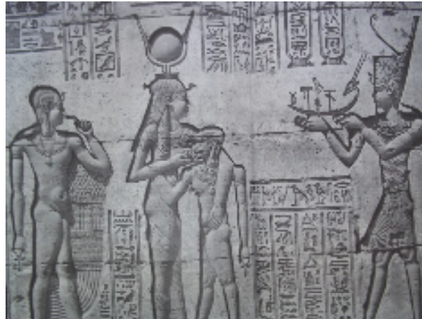
Fig.4 : La déesse Hathor entrain d'allaiter le roi, dans le mammisi du temple d'Hathor à Dendérah.

B.Watterson, Gods of Ancient Egypt , Hong Kong, 1996, p. 116-117.