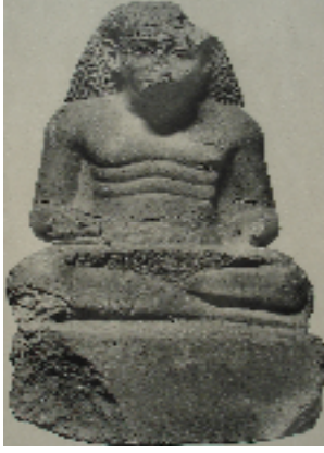
Fig.7 : statue de Menkheperresonb G.Legrain, CGC. Statues et statuettes de rois et de particuliers , t.I, Le Caire 1906, pl. 74.