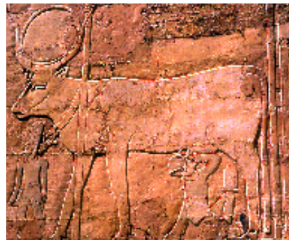
Fig.5: Thoutmosis III entrain d'allaiter de la déesse vache Hathor, dans la chapelle de Thoutmosis III à Deir el-Bahari.

M.Werbouck, Le temple d'Hatshepsout à Deir el Bahri , Brussel, 1948.