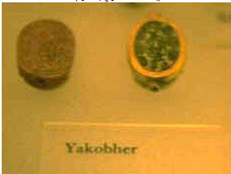
لوحة رقم (٢): ختم من أيام الهكسوس يحمل اسم "يعقوب حر" (متحف متروبوليتان للفن بنيويورك)