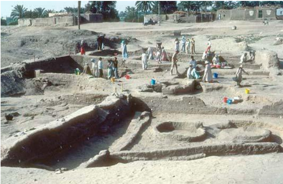
لوحة رقم (٤): من حفائر بيتاك في تل الضبعة