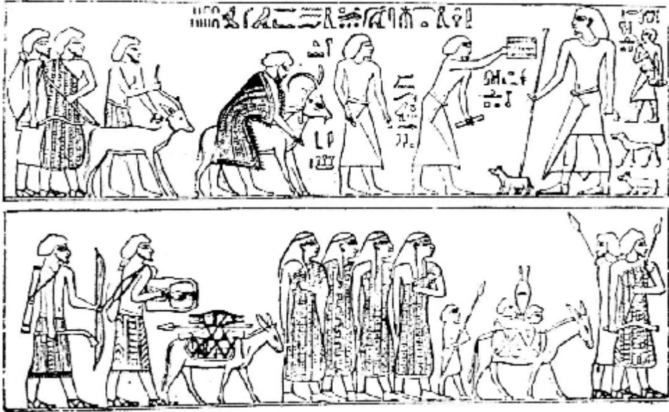
لوحة رقم (٣): منظر الآسيويين بمقبرة "خنوم حتب الثاني" ببني حسن