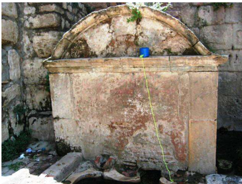
العين الرومانية بمدينة ميلة