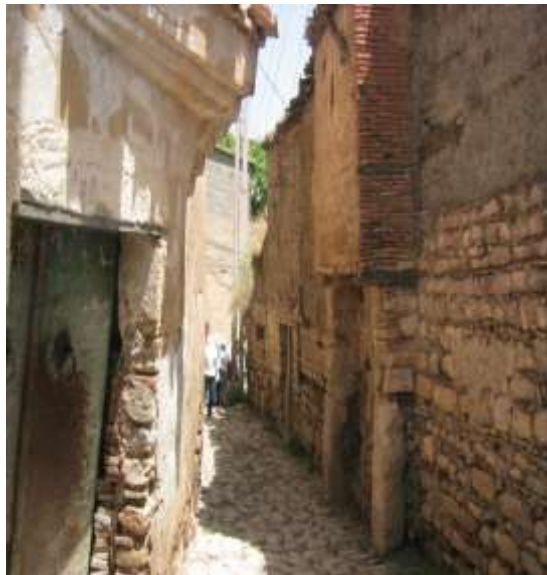
مناظر من المدينة العتيقة لميلة