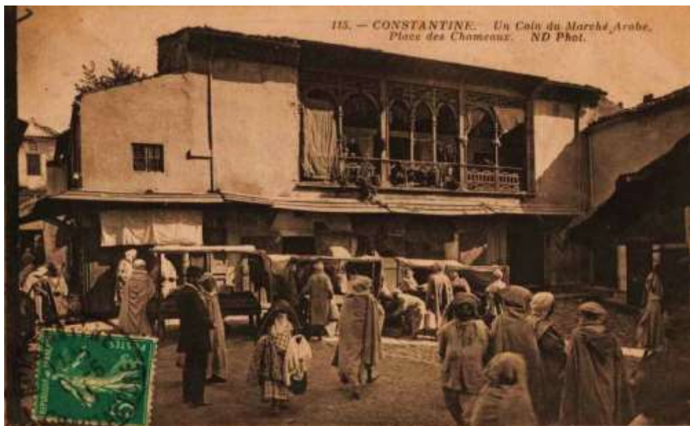
اللوحة رقم (٢): مدينة قسنطينة

القصبة السفلى ويظهر فيها الجامع الجديد وساحة السلطة - ساحة الشهداء اليوم - التي كانت تتوزع فيها مختلف الصناعات والأسواق اليومية. صورة لرحبة الجمال والتي لم يبق منها اليوم سوي الواجهة في عمق الصورة.