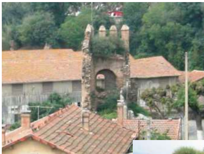
الصورة رقم (٢):

حصن القصبة لمدينة بجاية وهو اليوم عبارة عن متحف لكنه عرضة لأخطار النباتات والطحالب وهو يحتاج إلى الصيانة المستمرة والدائمة.