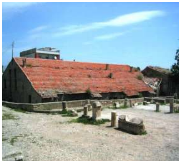
اللوحة رقم (٦):