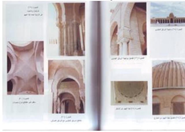
المصدر: نجوى عثمان، مساجد القيروان، دمشق ٢٠٠٠