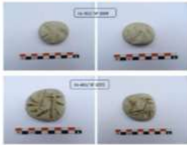
الشكل 19: أدوات حجرية للنسيج.