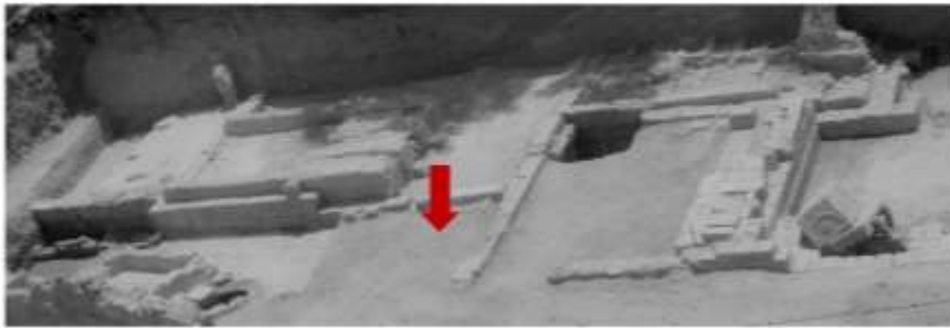
الشكل 3: الصرح المنقني والجدار الفاصل ما بين المقبرة والحي الصناعي.