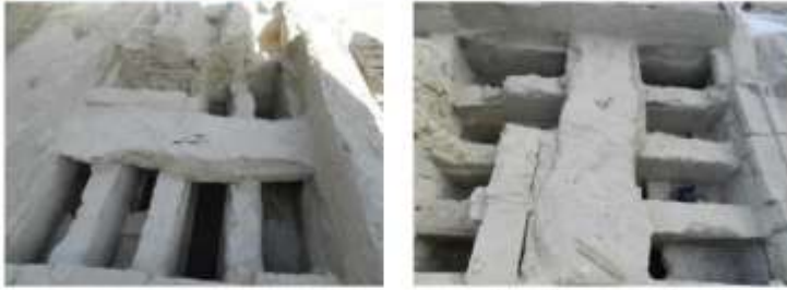
الشكل 9. الغرفة رقم 3. القسم الشرقي.