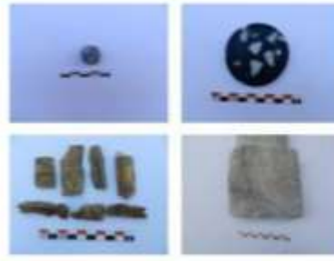
الشكل 18: شاهد قبر وأدوات زجاجية وعظمية.