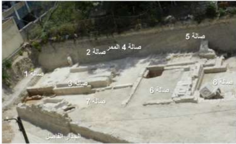
الشكل 6: توزيع الغرف المدفنية.