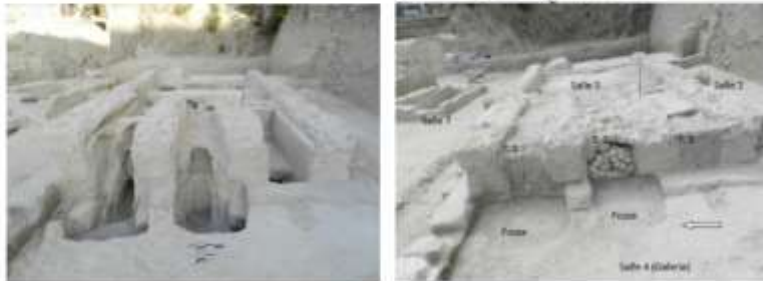
الشكل 8: الغرفة رقم 3. القسم الغربي. (تصوير شخصي)