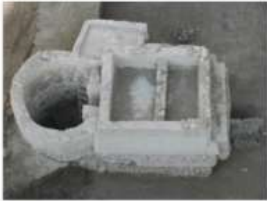
الشكل 15: الأحواض المزدوجة.