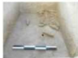
الشكل 5: قوارير العطور الموضوعة في أحد القبور أو في حشوات الجدران. (تصوير شخصي)