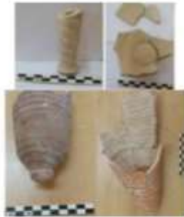
الشكل 21: قارورة عطر وجرار خزن صناعة صيدا.