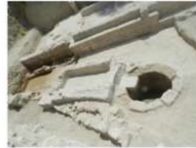
الشكل 14: الغرفة رقم 7.