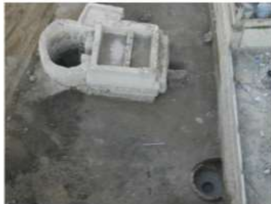
الشكل 4: المنطقة الصناعية.