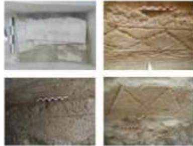
الشكل 12: تابوت من الرصاص وجدران قبور مزخرفة بالجص المطبق بقوالب تشبه التوابيت الرصاصية.