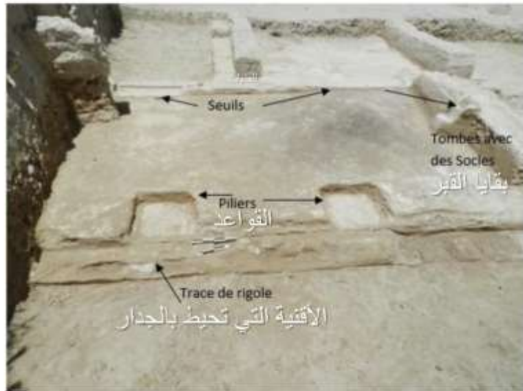
الشكل 7: الغرفة رقم 1.