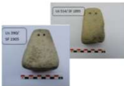
الشكل 23: نقالات للنسيج.