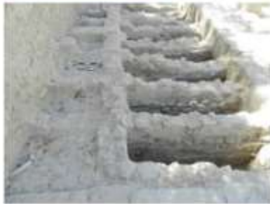
الشكل 13: الغرفة رقم 5.