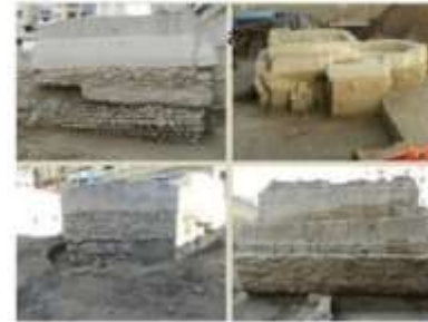
الشكل 16: مقاطع المنشأة الصناعية.