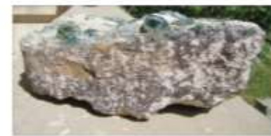
الشكل 24: حجر كلسي عليه آثار زجاج خلم.