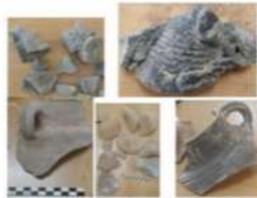
الشكل 20: فخار ذاتب وأواني الطبخ صناعة صيدا.