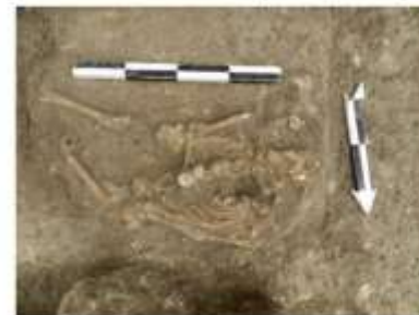
الشكل 17: هيكل عظمي ضمن حفرة في التراب وهيكل عظمي ضمن جرة.