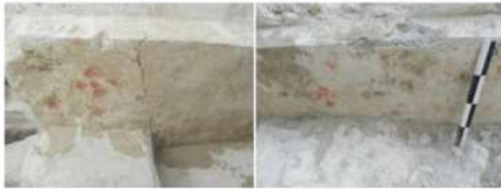
الشكل 10-11: التلوين على الجص في الغرفة رقم 3.