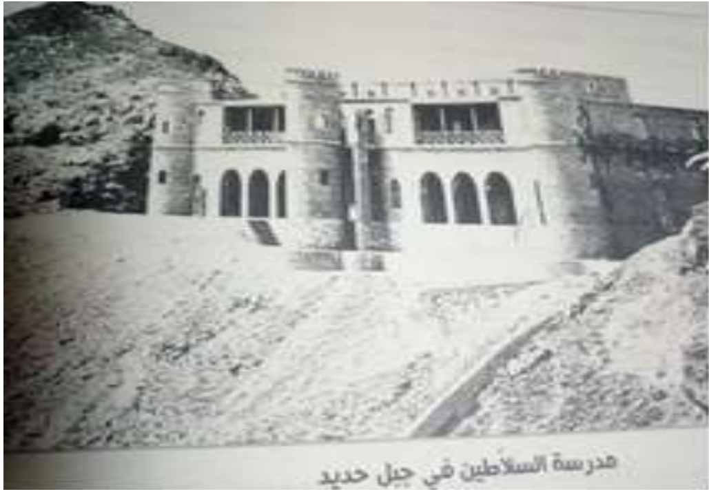
شكل (٧) مبنى مدرسة جبل حديد.