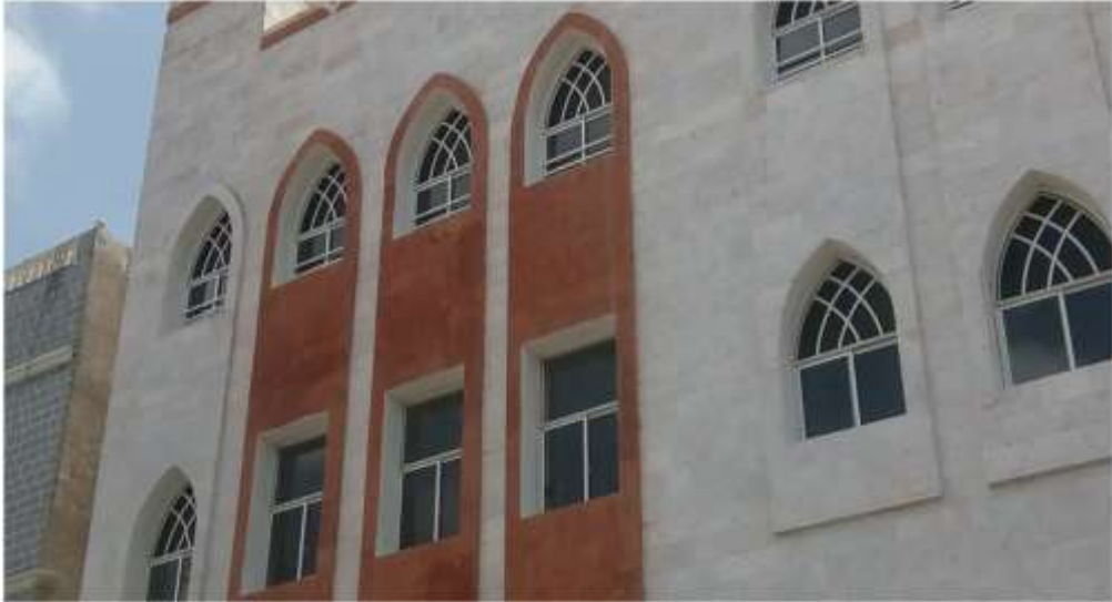
شكل (٥) مبنى مسجد حامد قبل التغيير وبعده.