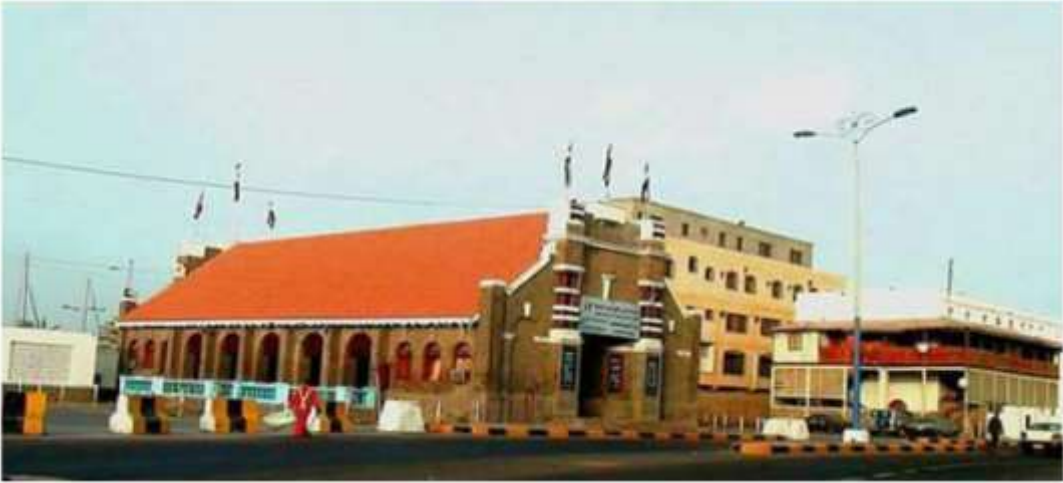
شكل (٢) مبنى الرصيف قبل الحرب وبعدها.