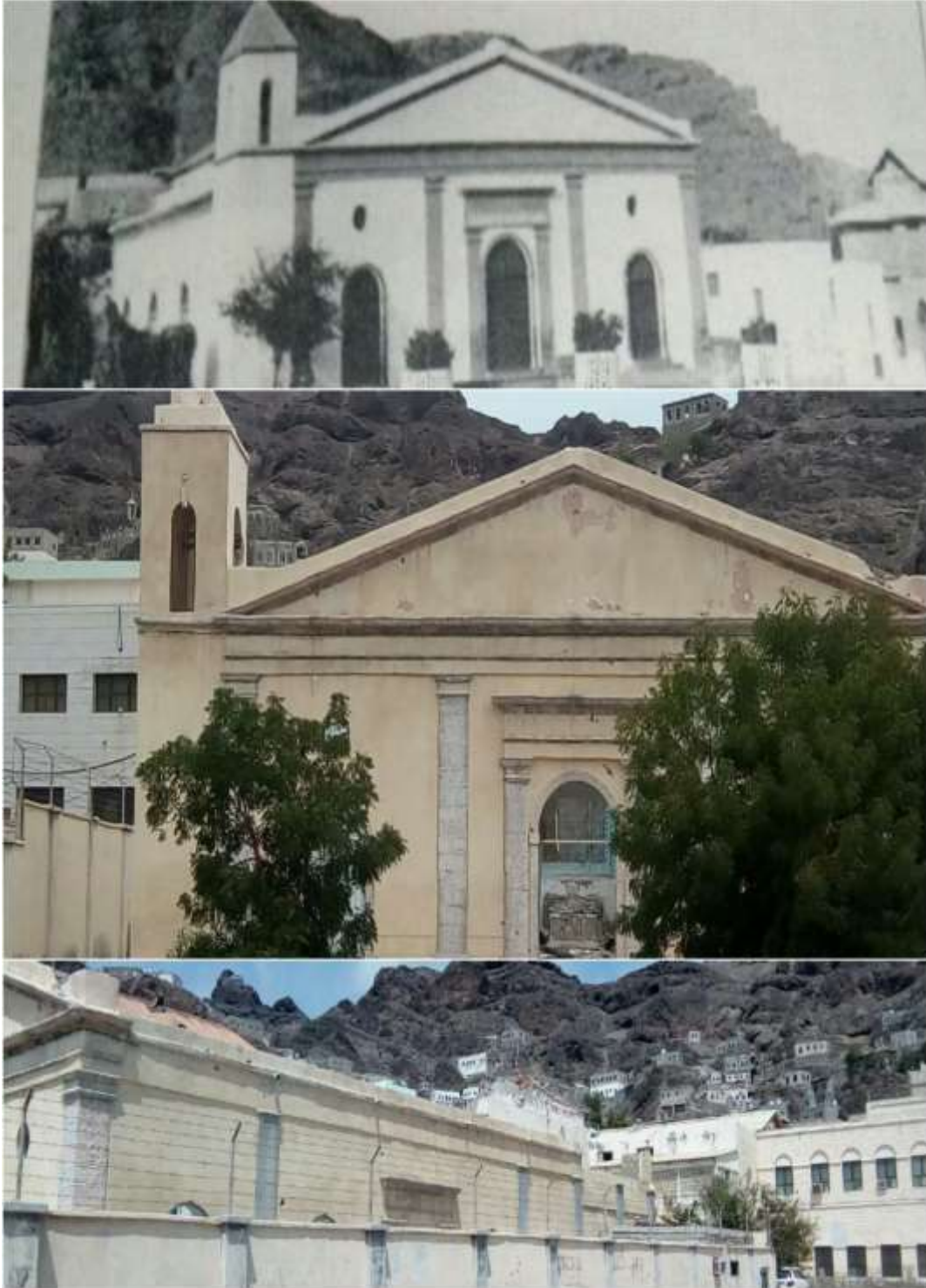
شكل (٤) وضع كنيسة سانت جوزيف.