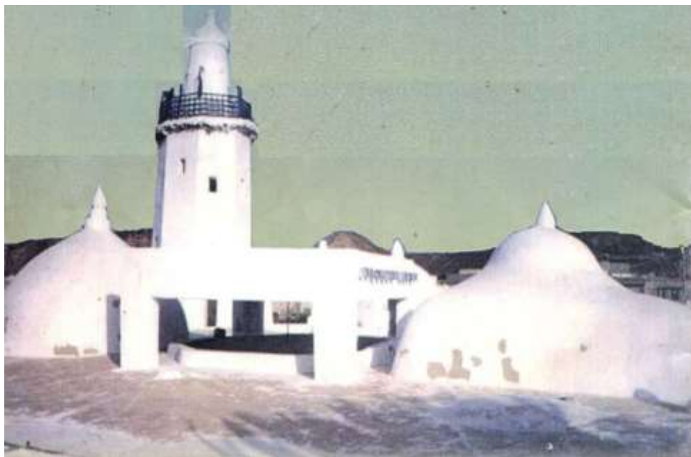
شكل (٩) جامع النقعة قبل عملية الهدم.