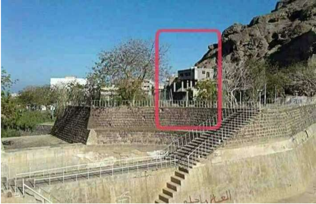
البناء العشوائي في صهاريج عدن.