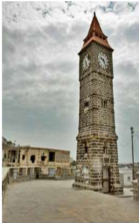
الزحف العشوائي على ساعة بيج بن التواهي.