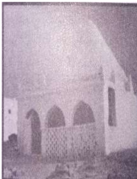
قبة مولى الجيش وضريحه