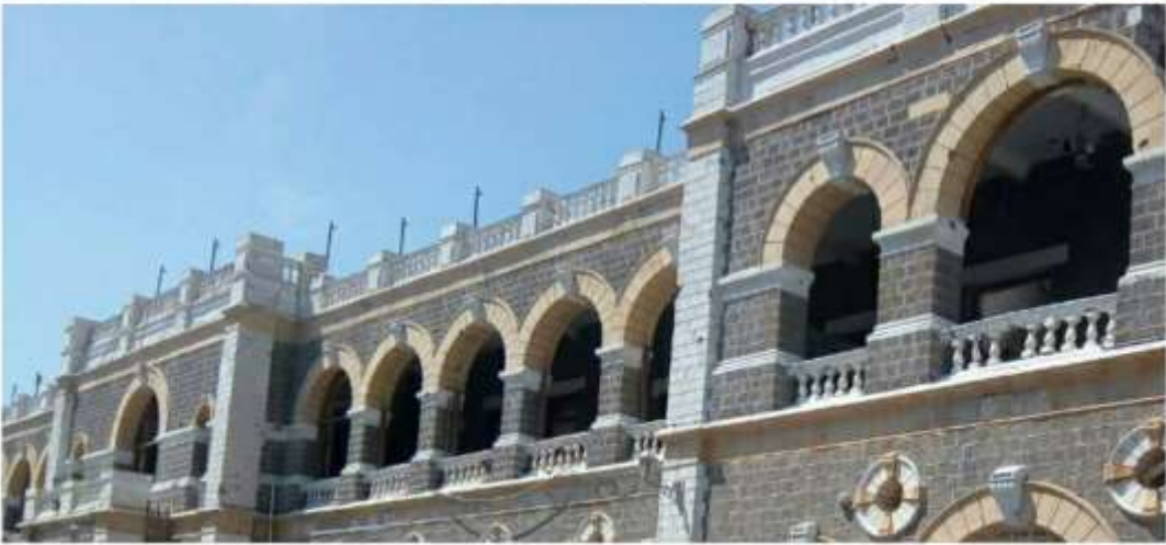
شكل (١) المتحف قبل الحرب وبعدها