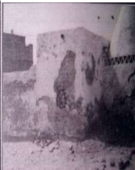
قبة مولى الربع وضريحه