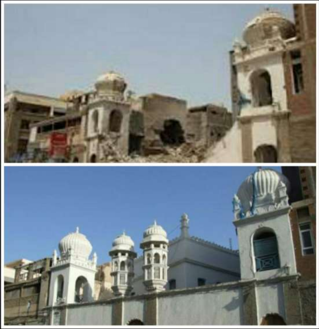
شكل (٦) مسجد الخوجه قبل الحرب وبعدها.