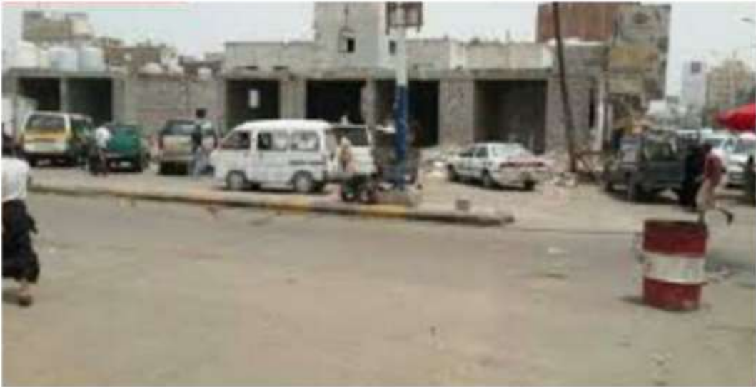
شكل (٣) شرطة الشيخ عثمان قبل السطو وبعده.