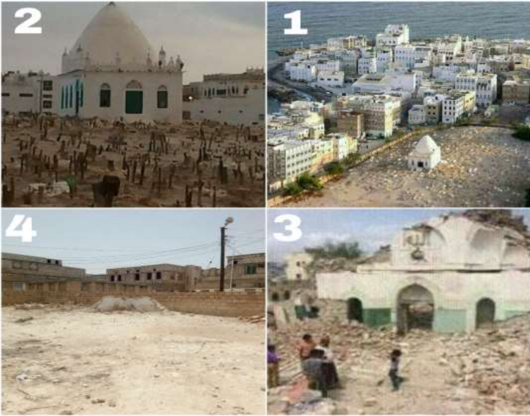
شكل (٨) ضريح الشيخ يعقوب وقبته قبل الهدم وبعده.