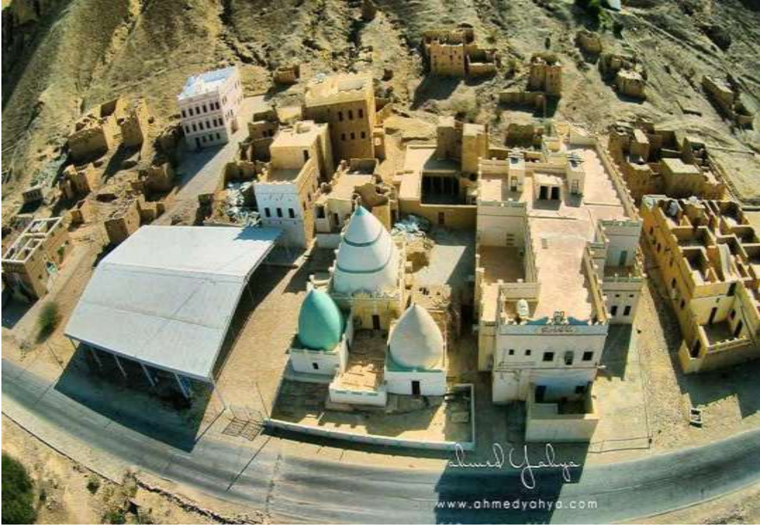
المشهد (أضرحة آل العطاس وقببهم)، تقع أول وادي دوعن (حضر موت).